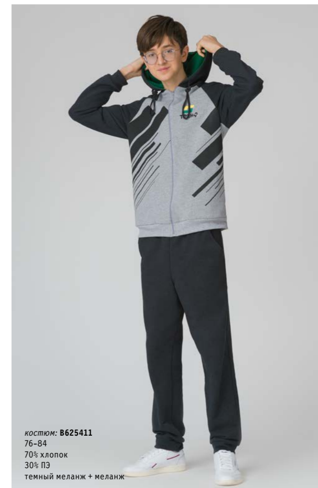
костюм: В625411 76-84 70% хлопок 30% ПЭ темный меланж + меланж