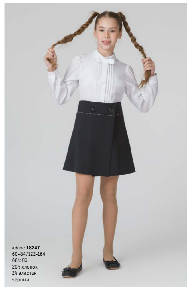
юбка: 18247 60-84/122-164 68% ПЭ 20% хлопок 2% эластан черный