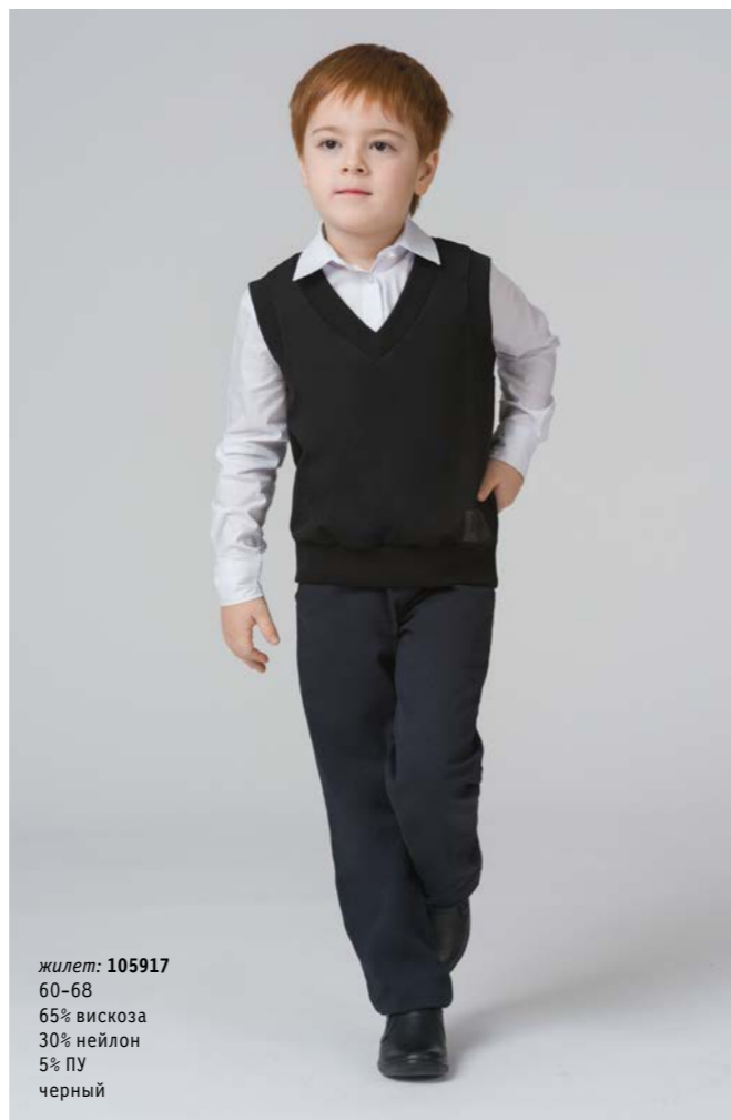
жилет: 105917 60-68 65% вискоза 30% нейлон 5% ПУ черный