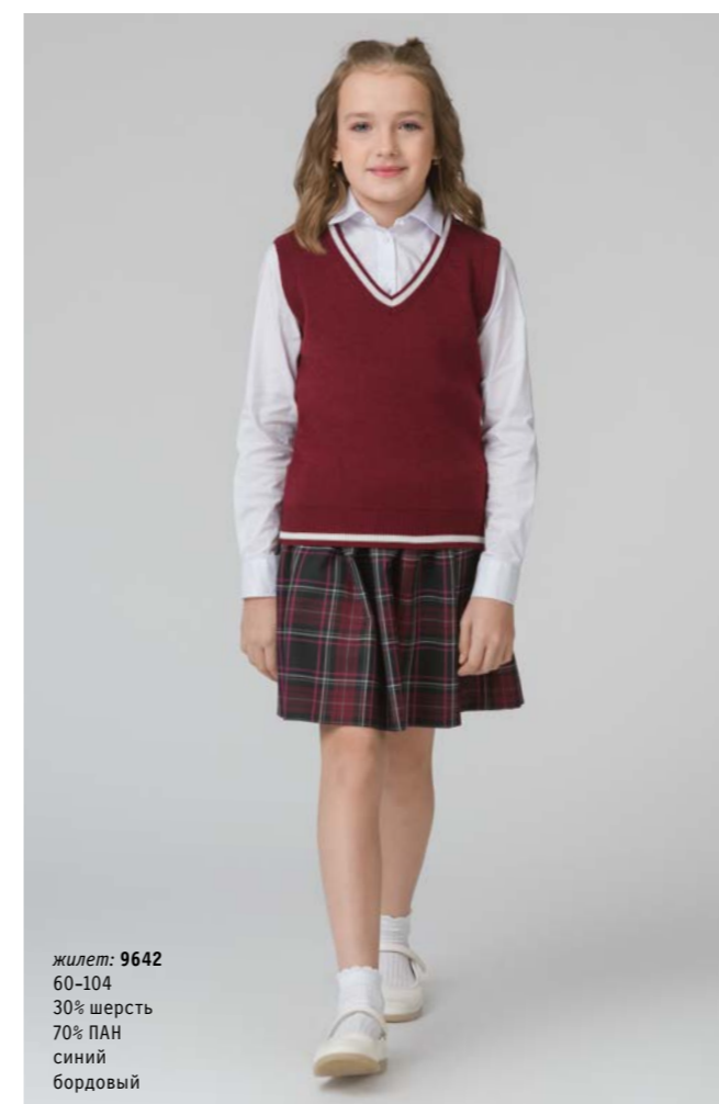
жилет: 9642 60-104 30% шерсть 70% ПАН синий бордовый