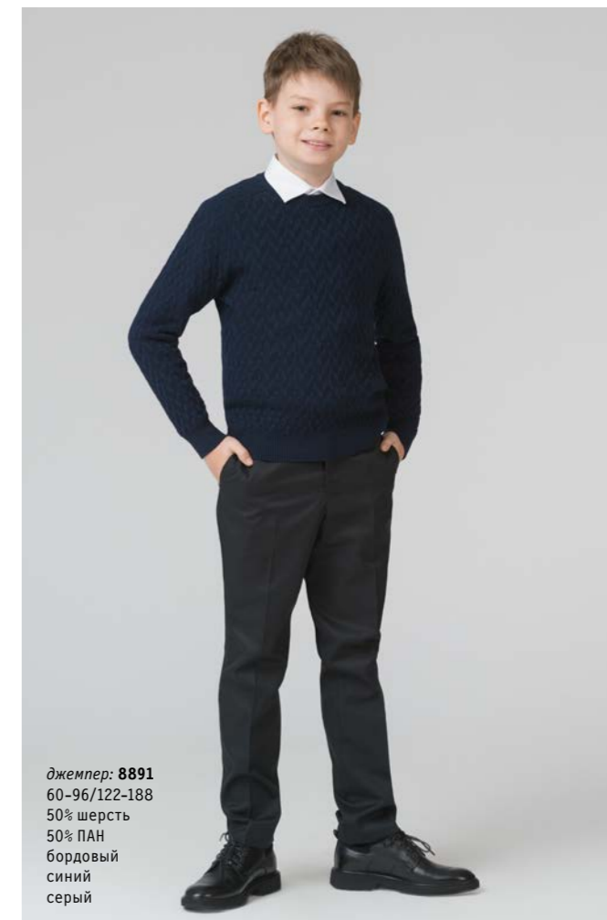
джерсер: 8891 60-96/122-188 50% шерсть 50% ПАН бордовый синий серый