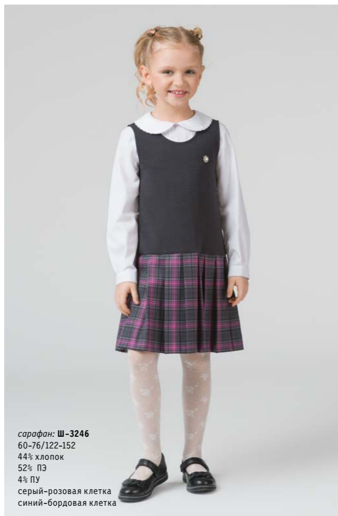
сарафан: Ш-3246 60-76/122-152 44% хлопок 52% ПЭ 4% ПУ серый-розовая клетка синий-бордовая клетка