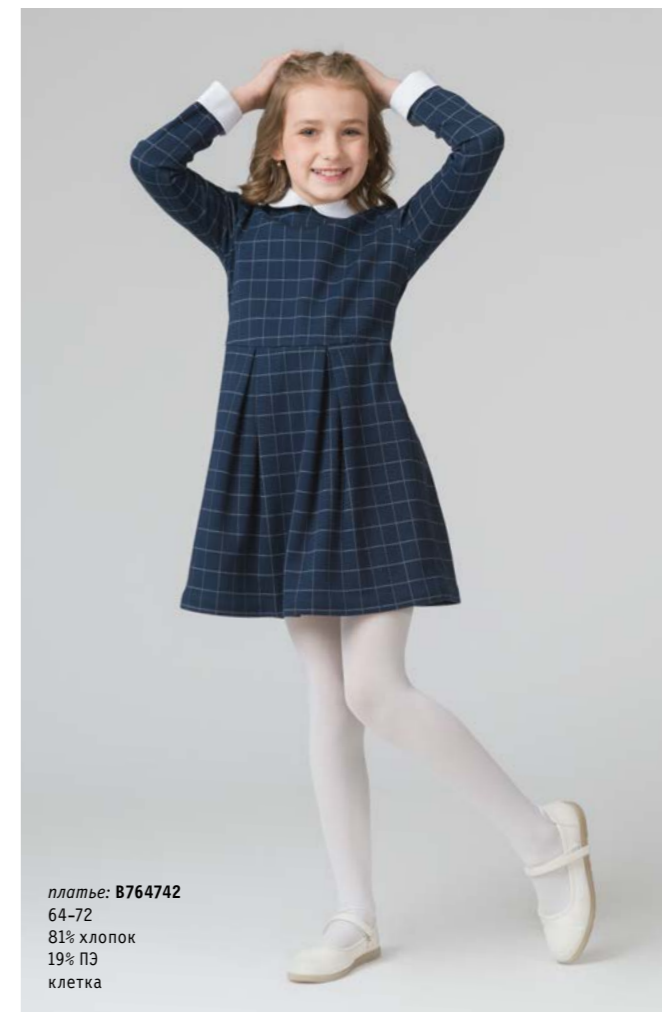
платье: B764742 64-72 81% хлопок 19% ПЭ клетка