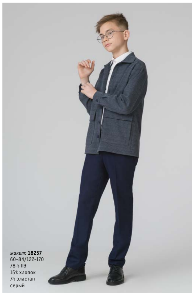
жакет: 18257 60-84/122-170 78% ПЭ 15% хлопок 7% эластан серый