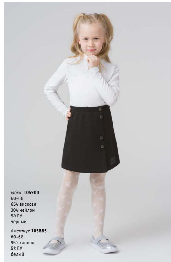
юбка: 105900 60-68 65% вискоза 30% нейлон 5% ПУ черный