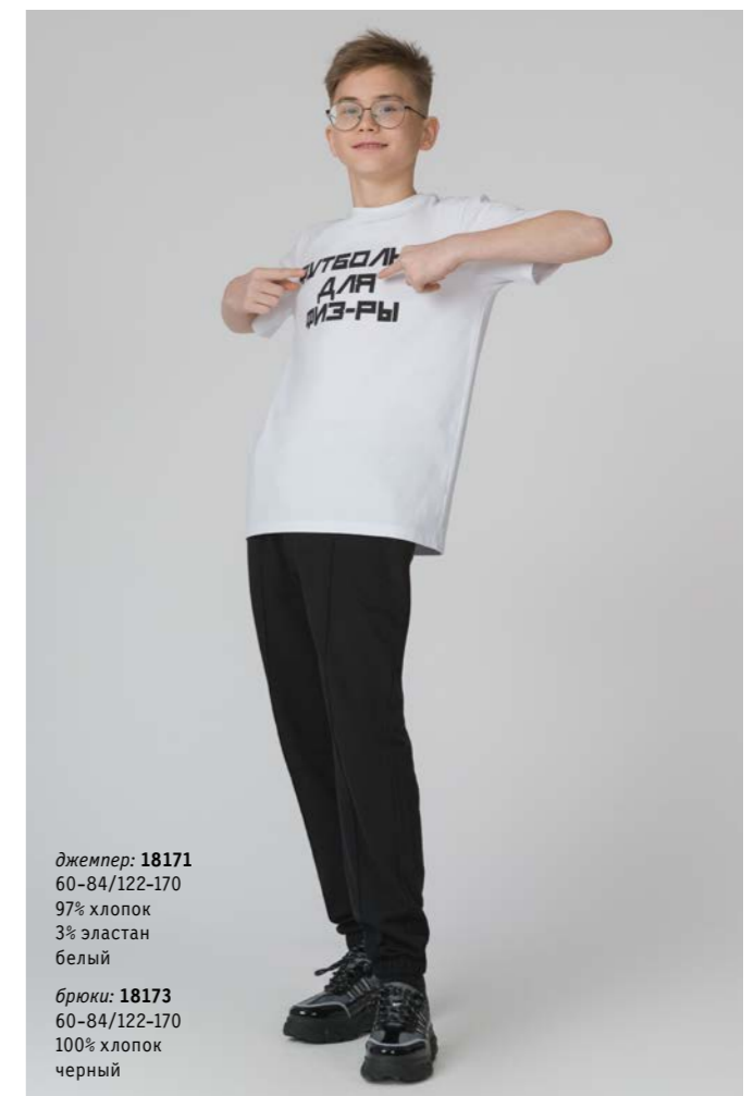
джерсер: 18171 60-84/122-170 97% хлопок 3% эластан белый брюки: 18173 60-84/122-170 100% хлопок черный