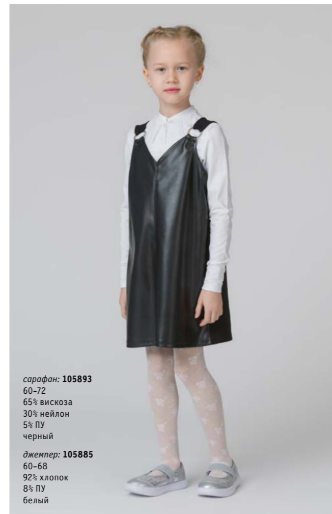
сарафан: 105893 60-72 65% вискоза 30% нейлон 5% ПУ черный джемпер: 105885 60-68 92% хлопок 8% ПУ белый

В школьной коллекции ОАО «КУПАЛИНКА» представлены джемпера в сочетании с сарафанами, жилетами, брюками, юбками, а также платьями базового кроя из трикотажных полотен. Модели имеют максимально простой и лаконичный дизайн: выполнены в строгой гамме, имеют прямой силуэт. Трикотажные джемпера – отличный вариант на каждый день. Каждый из них одинаково хорошо сочетается как с классическими моделями, так и с выполненными в спортивном стиле.