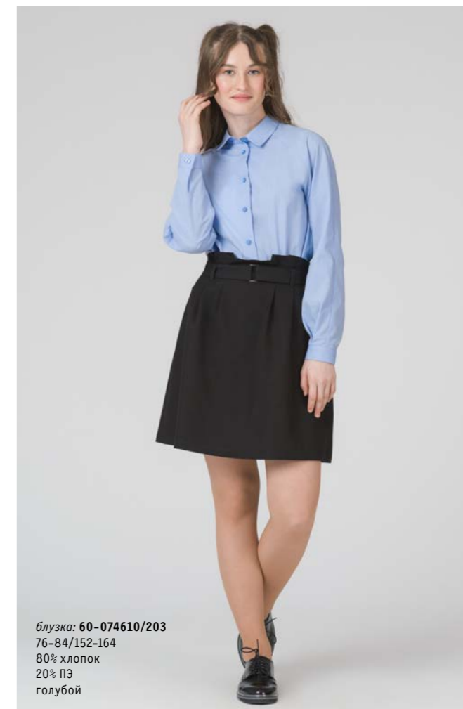
блузка: 60-074610/203 76-84/152-164 80% хлопок 20% ПЭ голубой