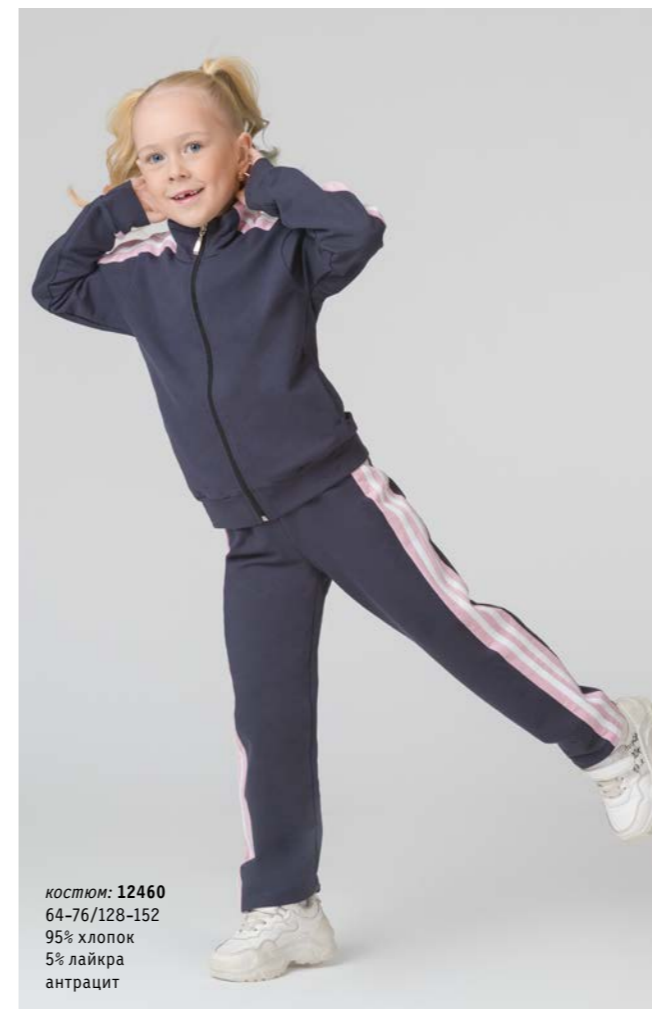
костюм: 12460 64-76/128-152 95% хлопок 5% лайкра антрацит