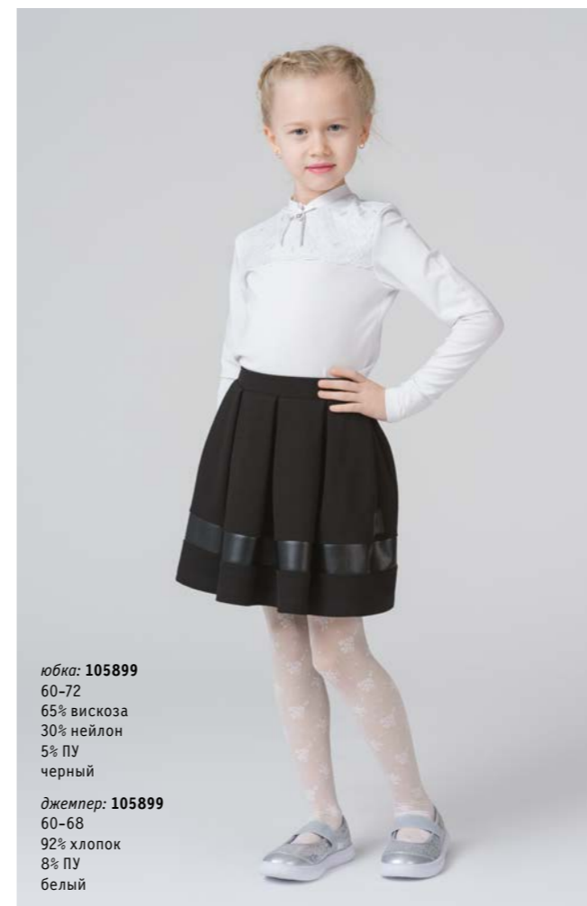
юбка: 105899 60-72 65% вискоза 30% нейлон 5% ПУ черный джемпер: 105899 60-68 92% хлопок 8% ПУ белый