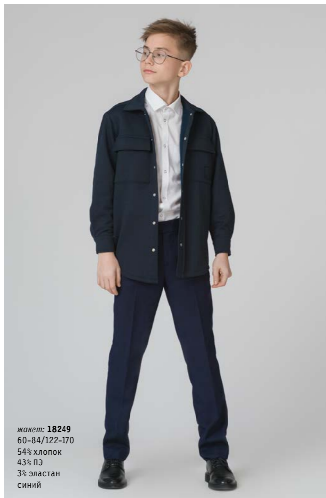
жакет: 18249 60-84/122-170 54% хлопок 43% ПЭ 3% эластан синий

Школьная коллекция ОАО «8 Марта» разработана для стильных и гармоничных учеников. Отличается современным дизайном, комфортом, сочетанием в одежде урбанистической культуры, «взрослой деловой» классики и элементов подростковой непосредственности. Коллекция включает как деловую одежду для школы "School", так и спортивную «Физ-ра».