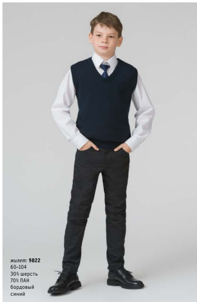
жилет: 9822 60-104 30% шерсть 70% ПАН бордовый синий