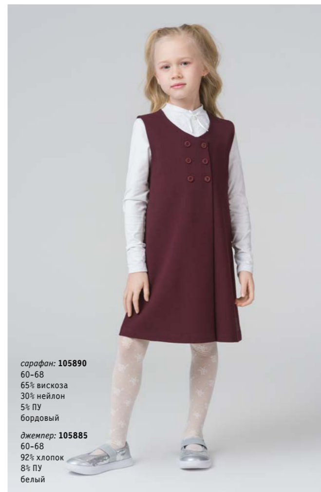
сарафан: 105890 60-68 65% вискоза 30% нейлон 5% ПУ бордовый