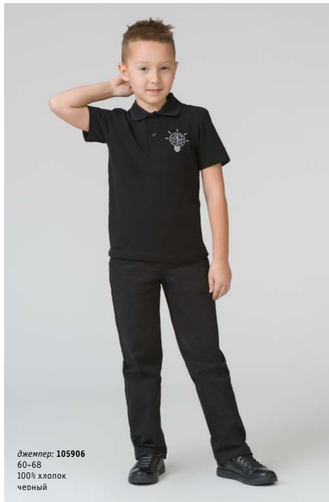
джерсер: 105906 60-68 100% хлопок черный