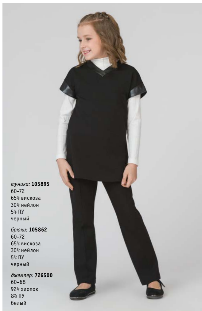
туника: 105895 60-72 65% вискоза 30% нейлон 5% ПУ черный