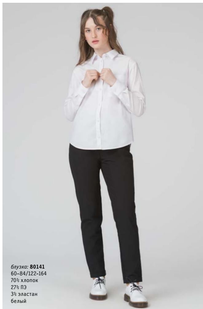
блузка: 80141 60-84/122-164 70% хлопок 27% ПЭ 3% эластан белый

Одежда SILVER GREY – это не просто одежда, а способ поиска своей индивидуальности и самовыражения.