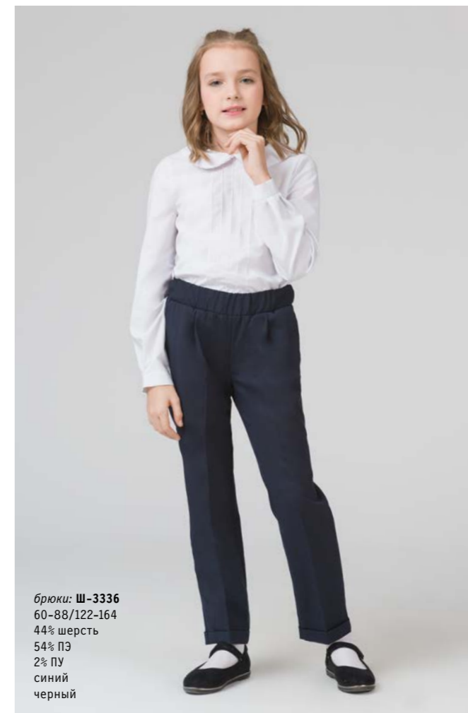
брюки: Ш-3336 60-88/122-164 44% шерсть 54% ПЭ 2% ПУ синий черный