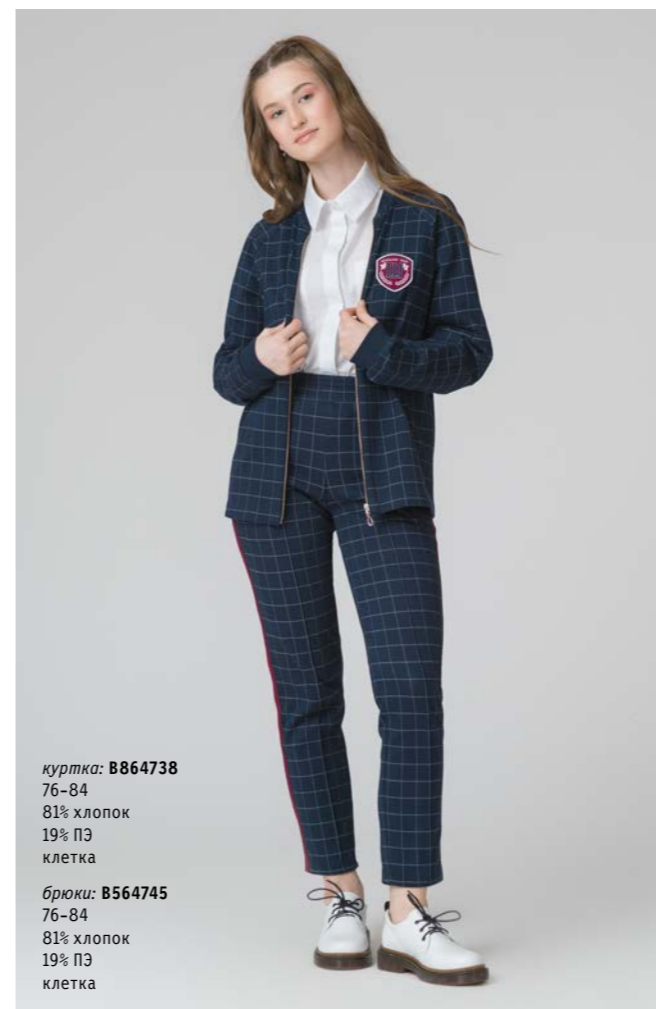
куртка: B864738 76-84 81% хлопок 19% ПЭ клетка