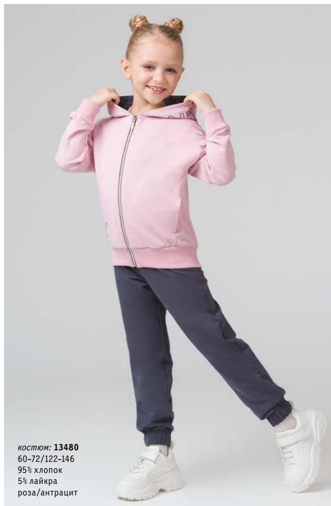
костюм: 13480 60-72/122-146 95% хлопок 5% лайкра роза/антрацит