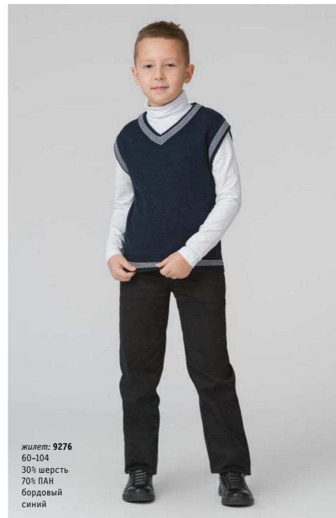
жилет: 9276 60-104 30% шерсть 70% ПАН бордовый синий