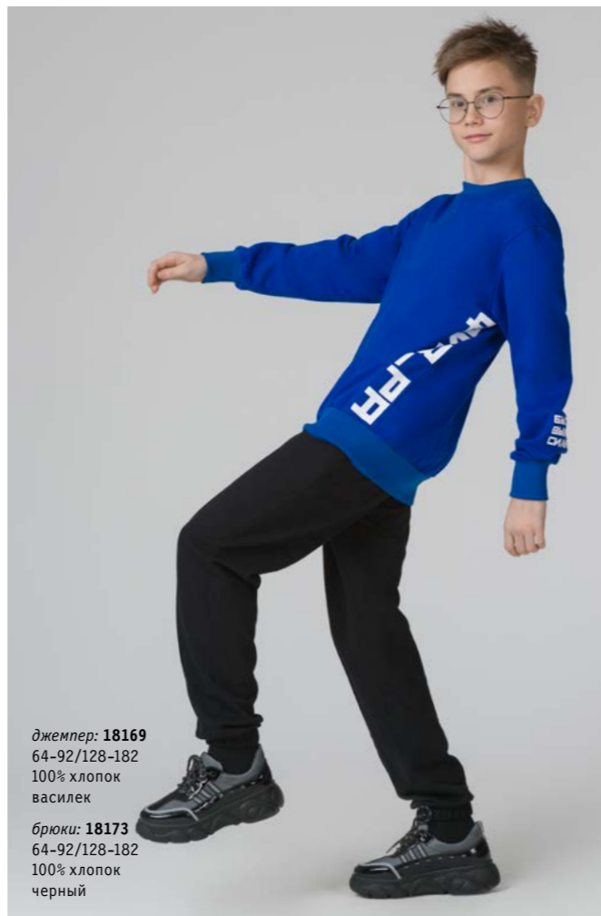
джерпер: 18169 64-92/128-182 100% хлопок василек