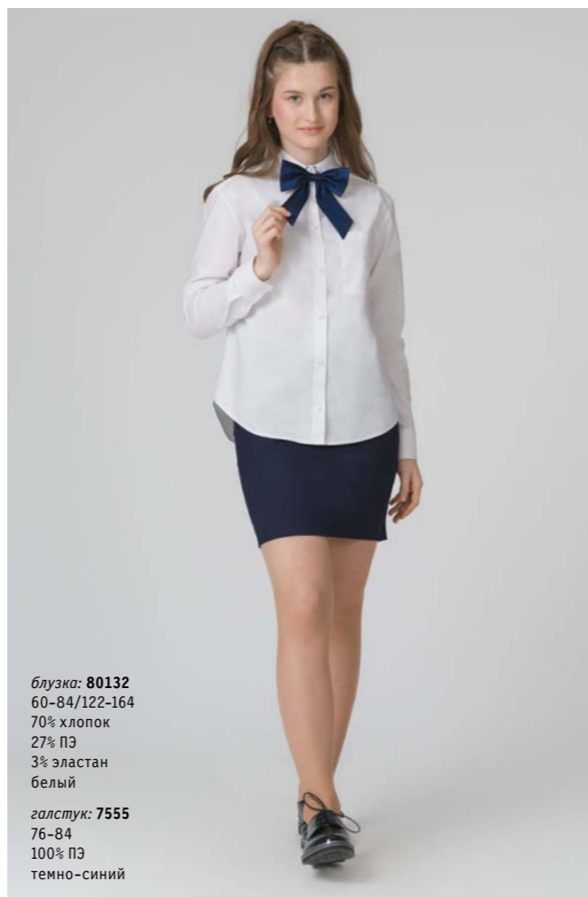
блузка: 80132 60-84/122-164 70% хлопок 27% ПЭ 3% эластан белый галстук: 7555 76-84 100% ПЭ темно-синий