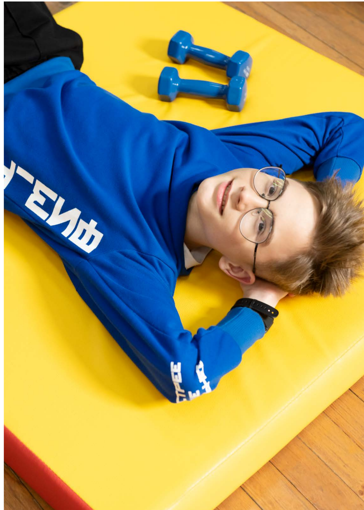
брюки: 18173 64-92/128-182 100% хлопок черный