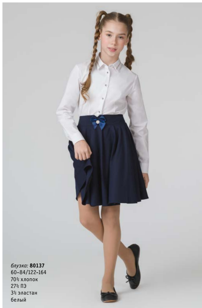
блузка: 80137 60-84/122-164 70% хлопок 27% ПЭ 3% эластан белый