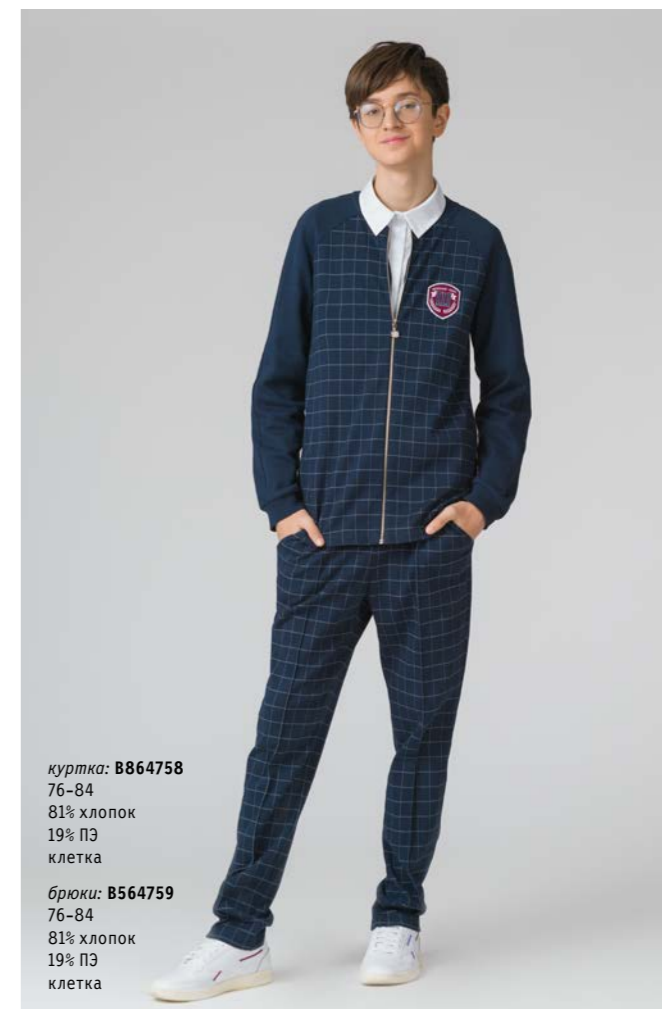
куртка: B864758 76-84 81% хлопок 19% ПЭ клетка