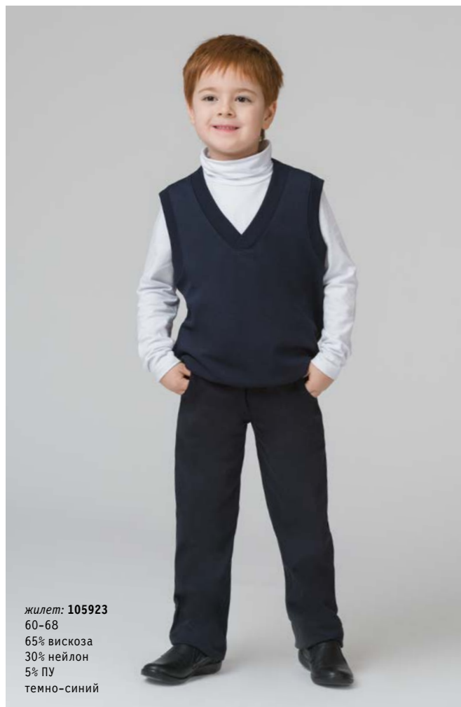
жилет: 105923 60-68 65% вискоза 30% нейлон 5% ПУ темно-синий