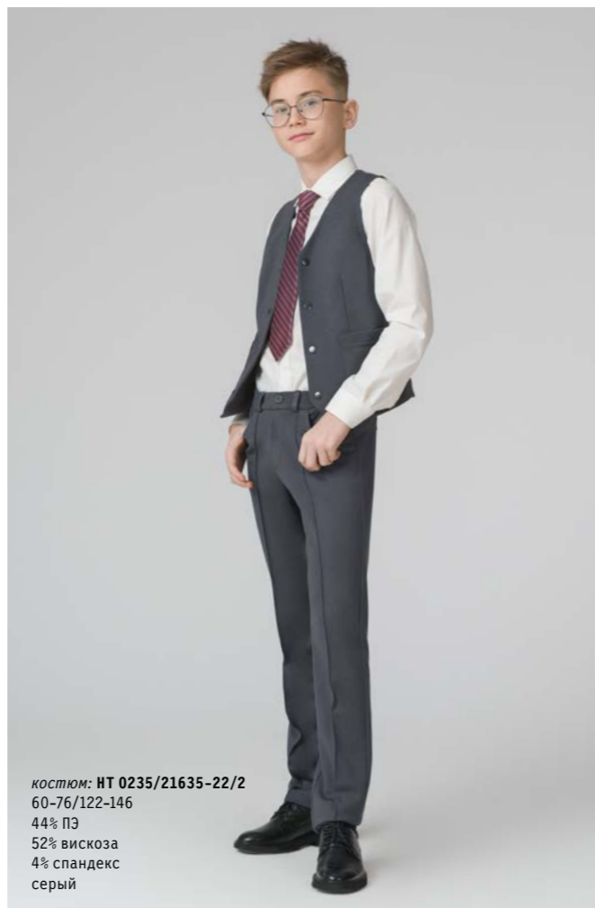
костюм: НТ 0235/21635-22/2 60-76/122-146 44% ПЭ 52% вискоза 4% спандекс серый