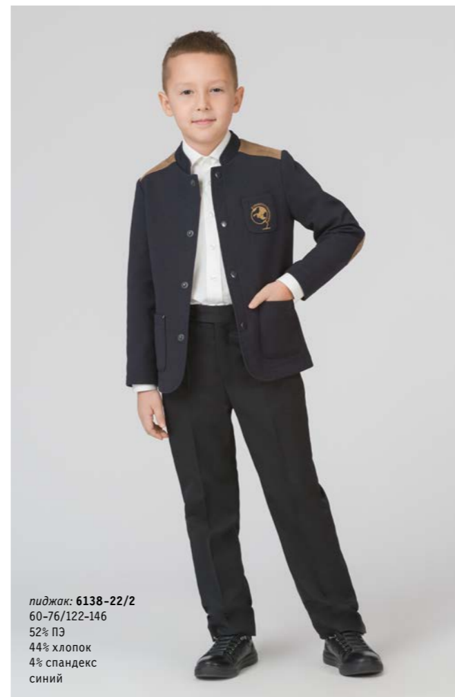
пиджак: 6138-22/2 60-76/122-146 52% ПЭ 44% хлопок 4% спандекс синий