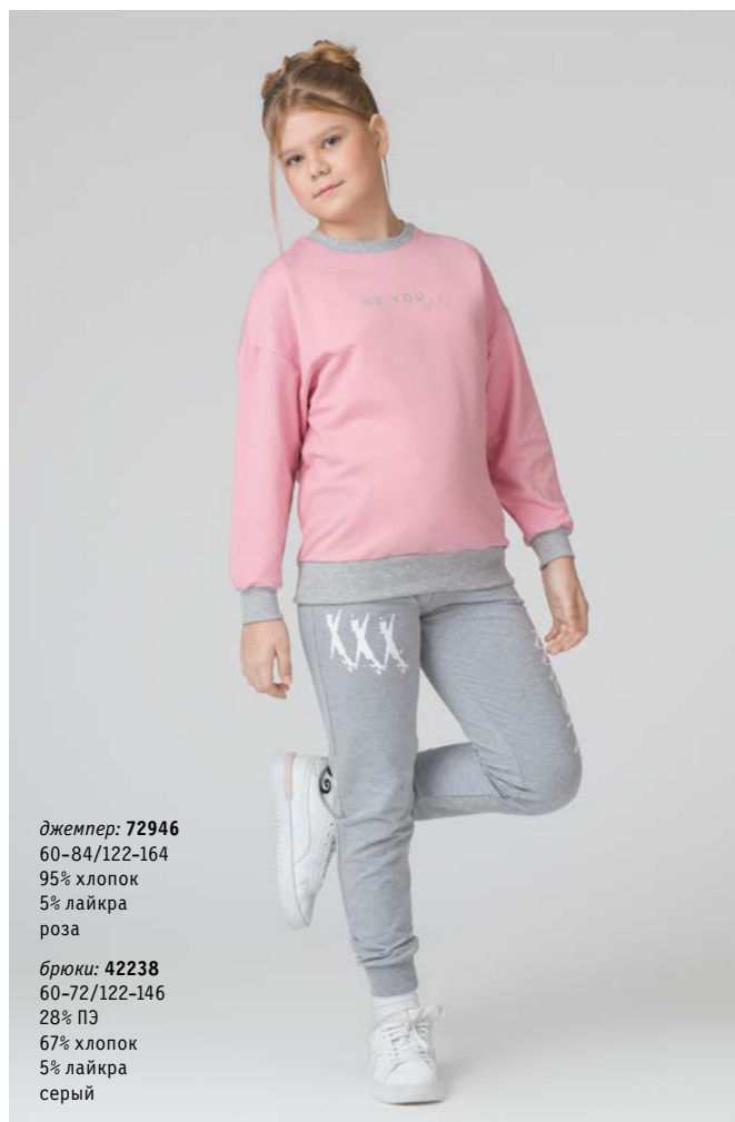
джерсер: 72946 60-84/122-164 95% хлопок 5% лайкра роза