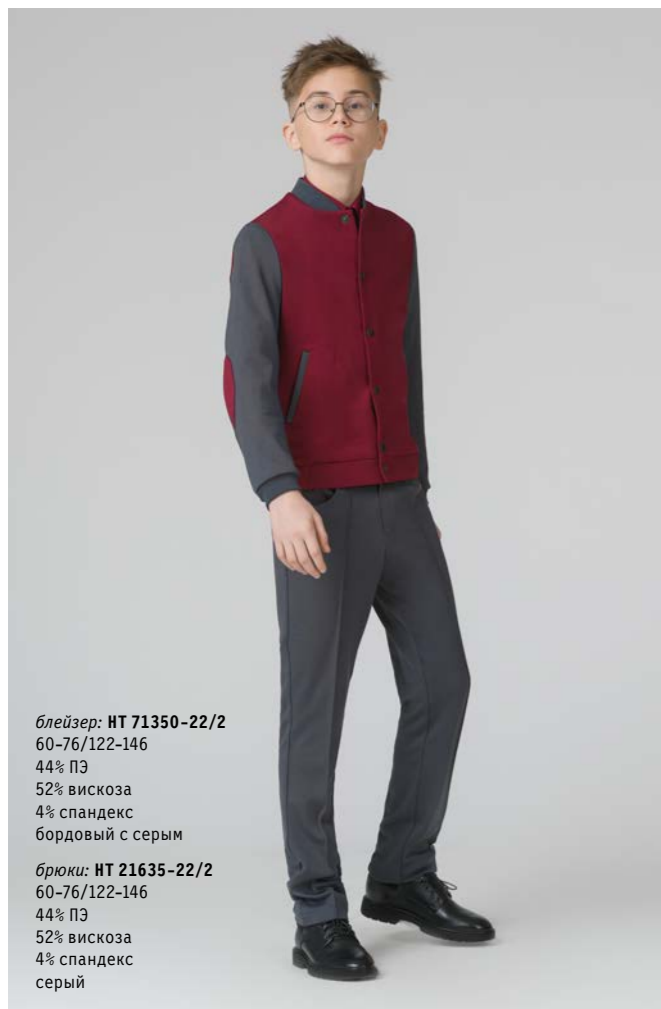
блейзер: НТ 71350-22/2 60-76/122-146 44% ПЭ 52% вискоза 4% спандекс бордовый с серым