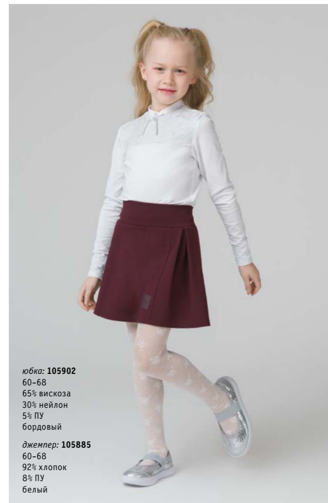
юбка: 105902 60-68 65% вискоза 30% нейлон 5% ПУ бордовый