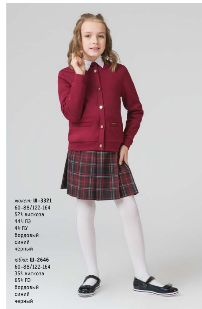
жакет: Ш-3321 60-88/122-164 52% вискоза 44% ПЭ 4% ПУ бордовый синий черный юбка: Ш-2646 60-88/122-164 35% вискоза 65% ПЭ бордовый синий черный