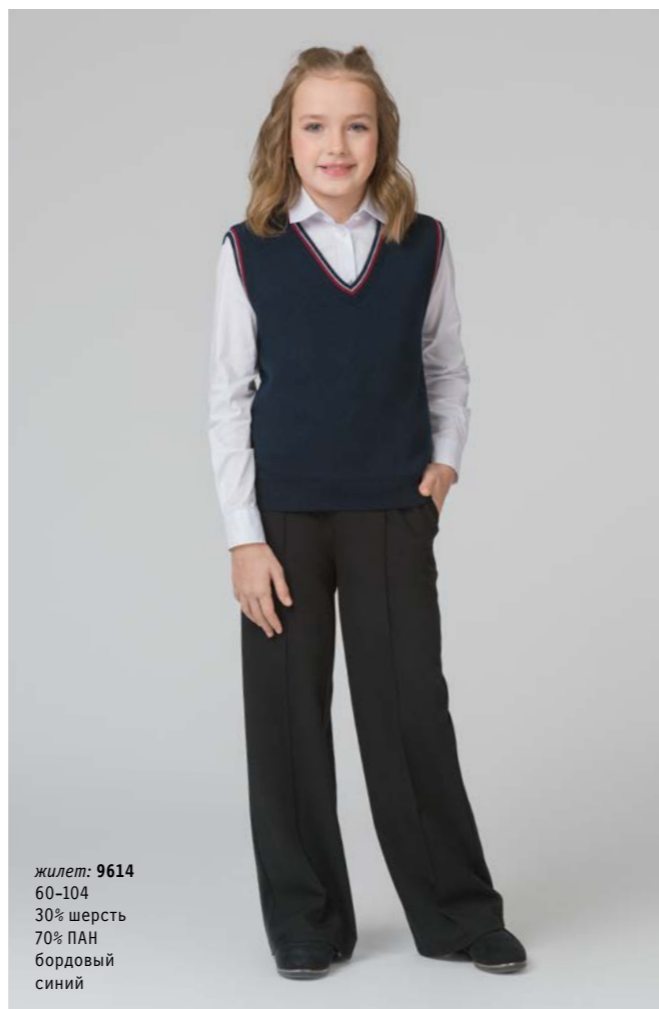
жилет: 9614 60-104 30% шерсть 70% ПАН бордовый синий