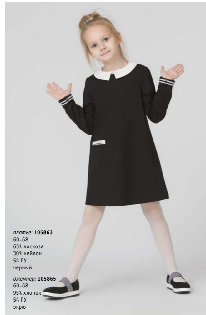
платье: 105863 60-68 65% вискоза 30% нейлон 5% ПУ черный