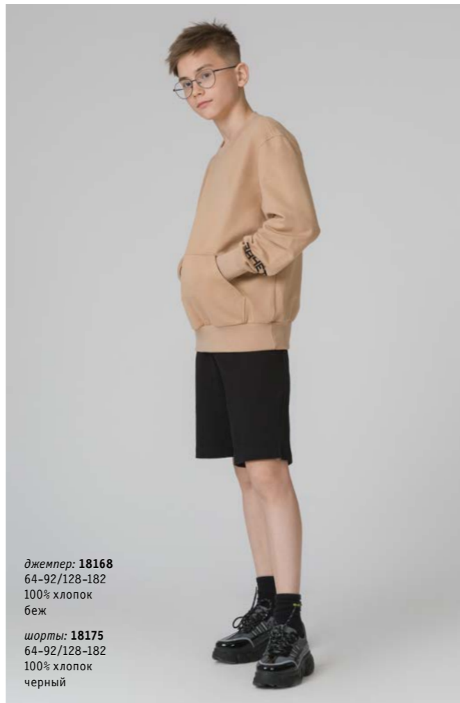
джерпер: 18168 64-92/128-182 100% хлопок беж