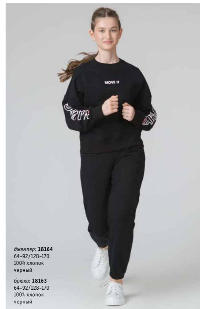
джерсер: 18164 64-92/128-170 100% хлопок черный брюки: 18163 64-92/128-170 100% хлопок черный