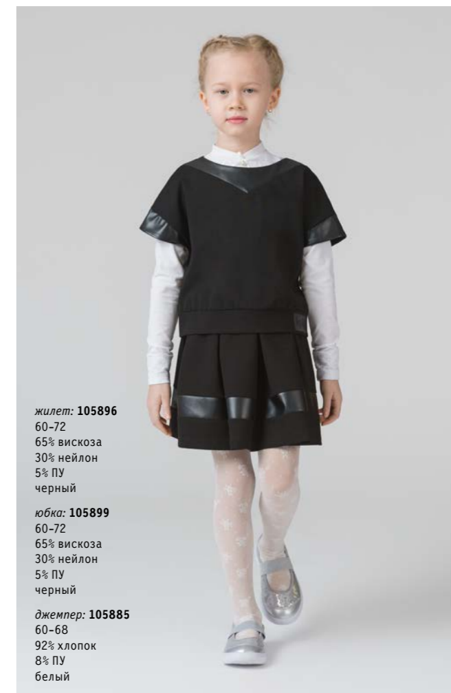
жилет: 105896 60-72 65% вискоза 30% нейлон 5% ПУ черный юбка: 105899 60-72 65% вискоза 30% нейлон 5% ПУ черный джемпер: 105885 60-68 92% хлопок 8% ПУ белый