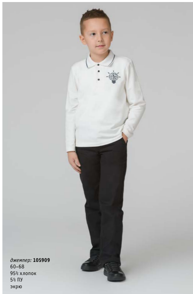
джерсер: 105909 60-68 95% хлопок 5% ПУ экрю