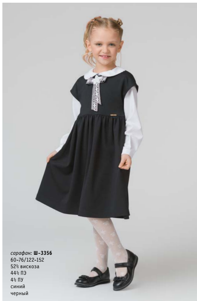
сарафан: Ш-3356 60-76/122-152 52% вискоза 44% ПЭ 4% ПУ синий черный