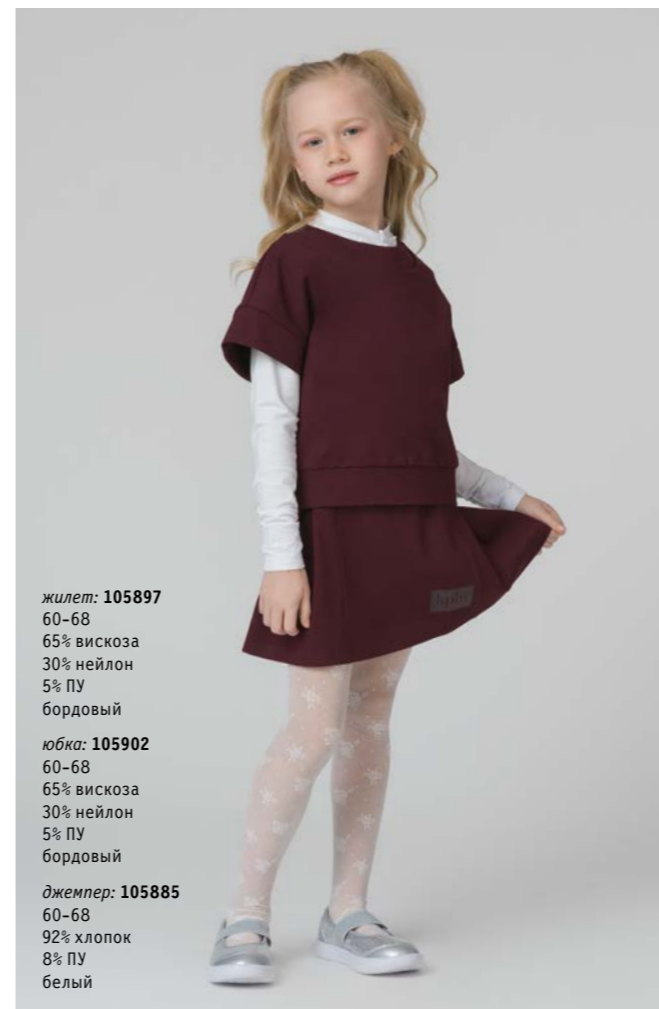
жилет: 105897 60-68 65% вискоза 30% нейлон 5% ПУ бордовый