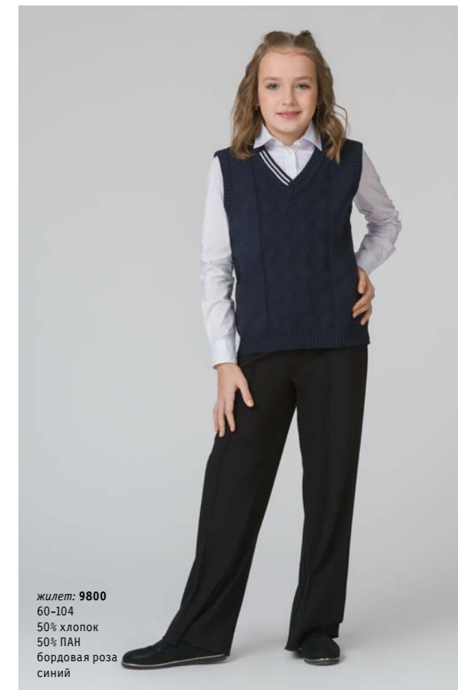
жилет: 9800 60-104 50% хлопок 50% ПАН бордовая роза синий