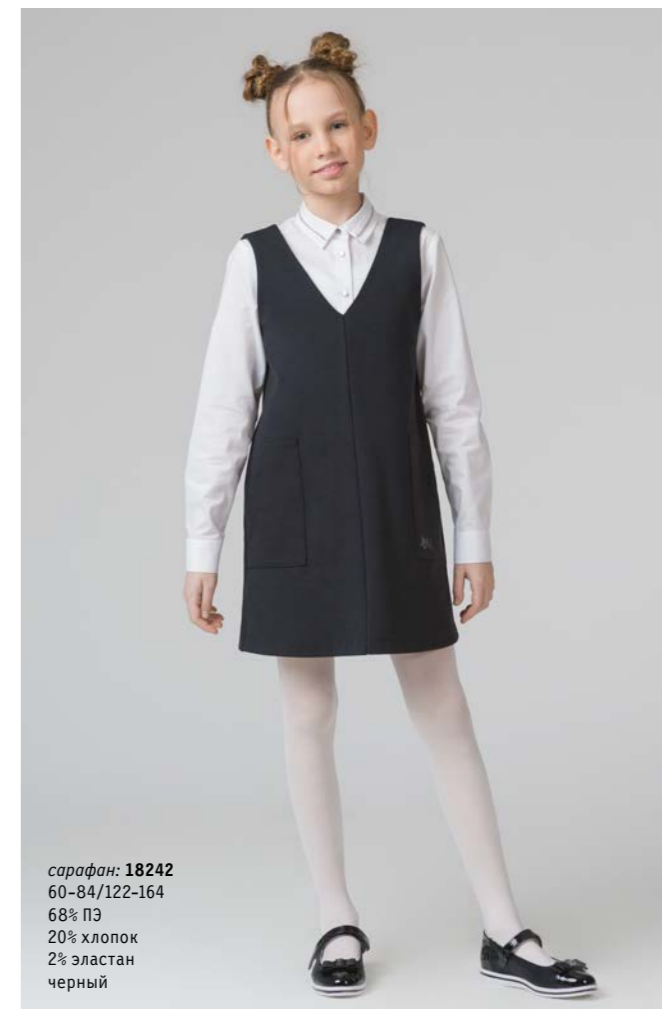
сарфан: 18242 60-84/122-164 68% ПЭ 20% хлопок 2% эластан черный