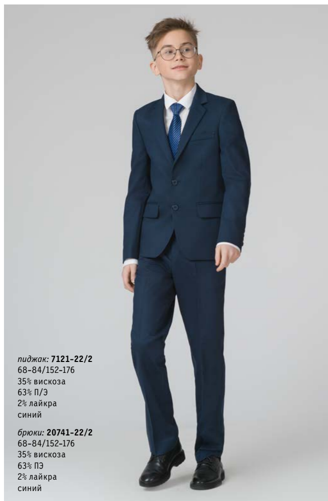
пиджак: 7121-22/2 68-84/152-176 35% вискоза 63% П/Э 2% лайкра синий