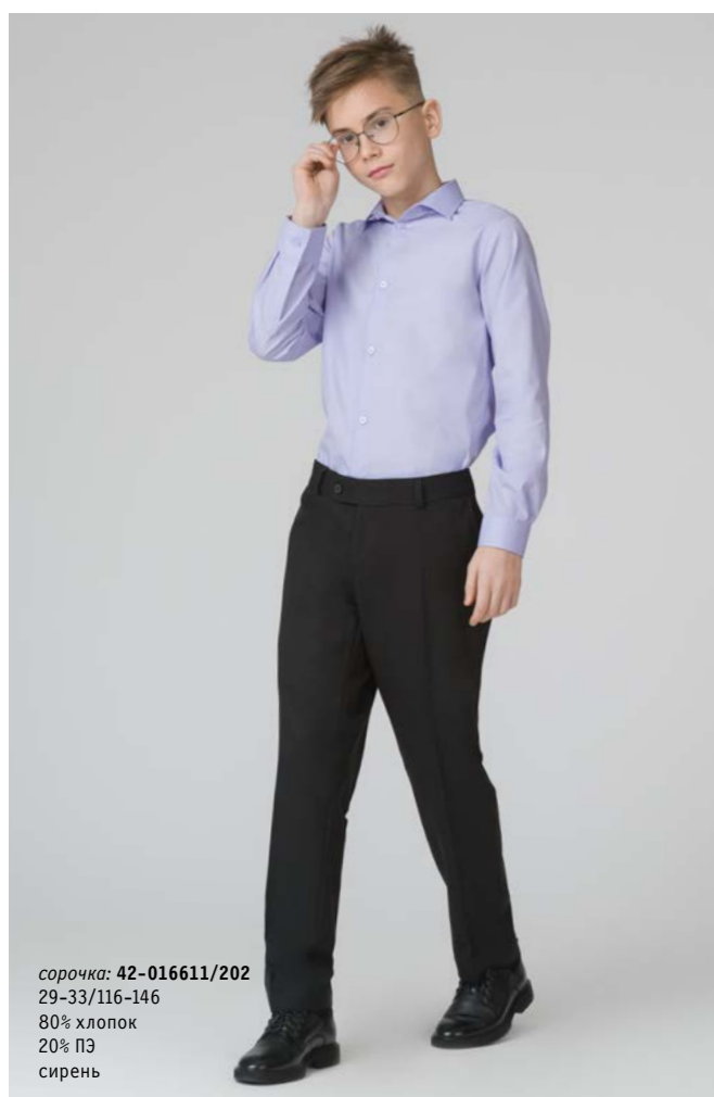
сорочка: 42-016611/202 29-33/116-146 80% хлопок 20% ПЭ сирень