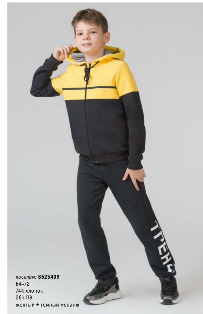
костюм: В625409 64-72 74% хлопок 26% ПЭ желтый + темный меланж