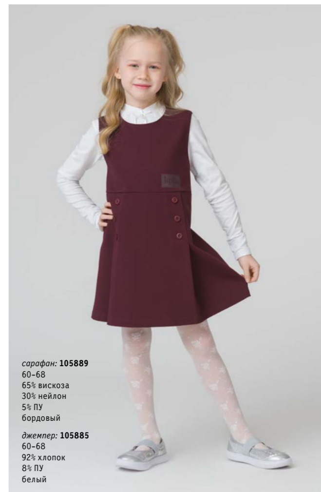
сарафан: 105889 60-68 65% вискоза 30% нейлон 5% ПУ бордовый