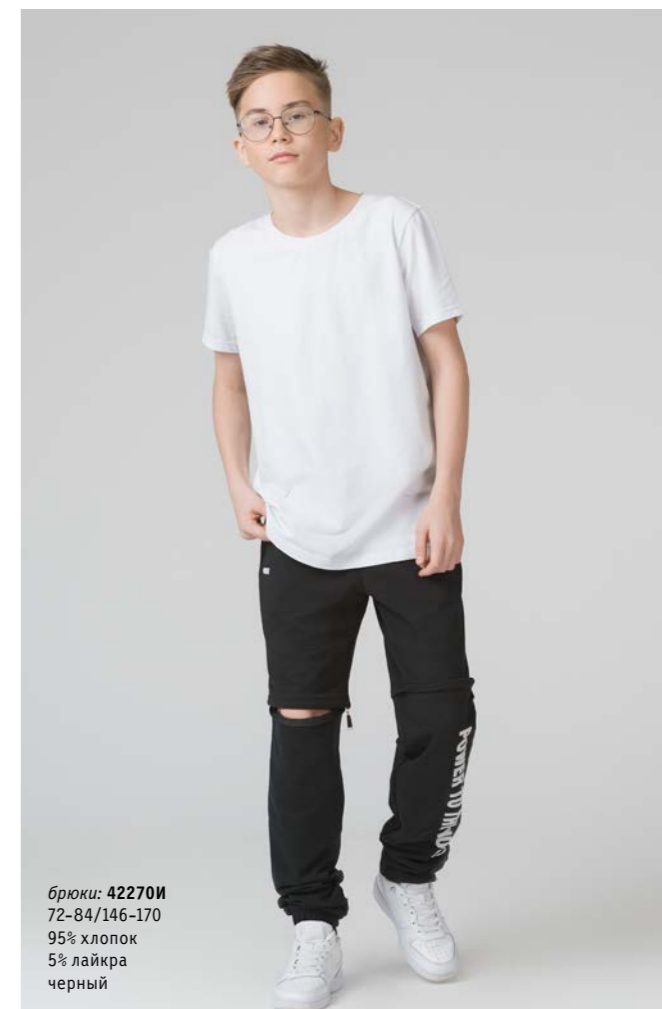
брюки: 42270И 72-84/146-170 95% хлопок 5% лайкра черный