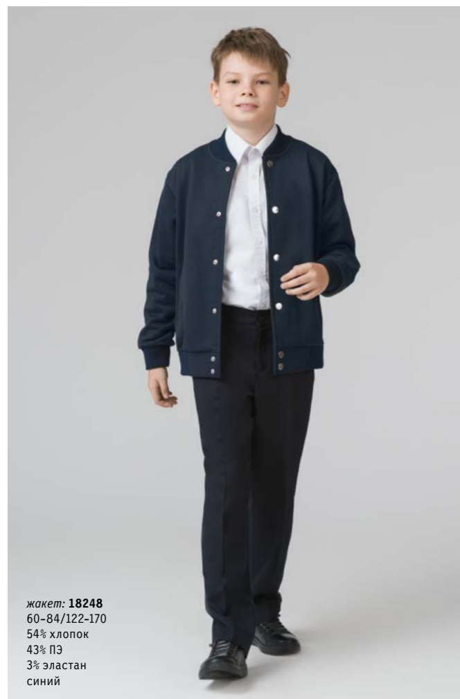
жакет: 18248 60-84/122-170 54% хлопок 43% ПЭ 3% эластан синий