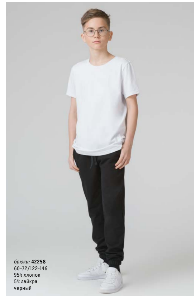
брюки: 42258 60-72/122-146 95% хлопок 5% лайкра черный