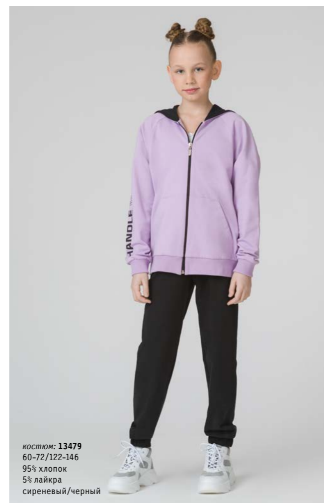
костюм: 13479 60-72/122-146 95% хлопок 5% лайкра сиреневый/черный