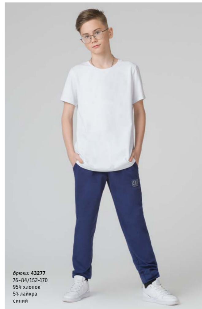
брюки: 43277 76-84/152-170 95% хлопок 5% лайкра синий