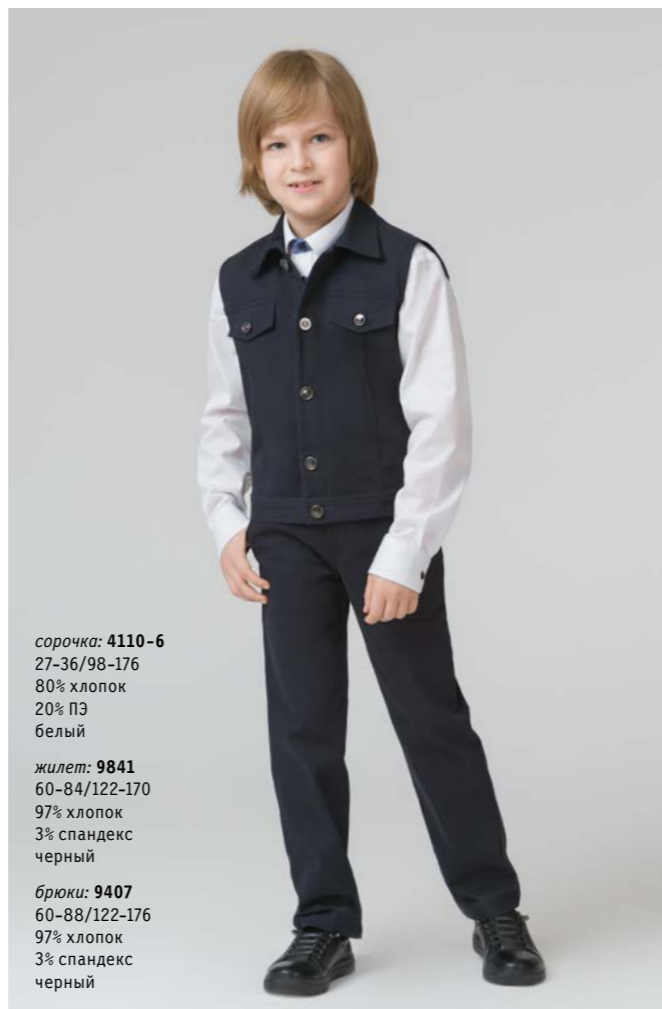
сорочка: 4110-6 27-36/98-176 80% хлопок 20% ПЭ белый жилет: 9841 60-84/122-170 97% хлопок 3% спандекс черный брюки: 9407 60-88/122-176 97% хлопок 3% спандекс черный