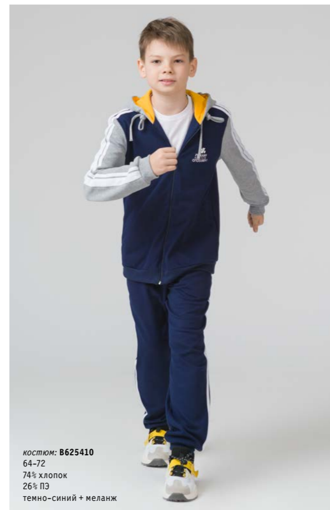
костюм: В625410 64-72 74% хлопок 26% ПЭ темно-синий + меланж