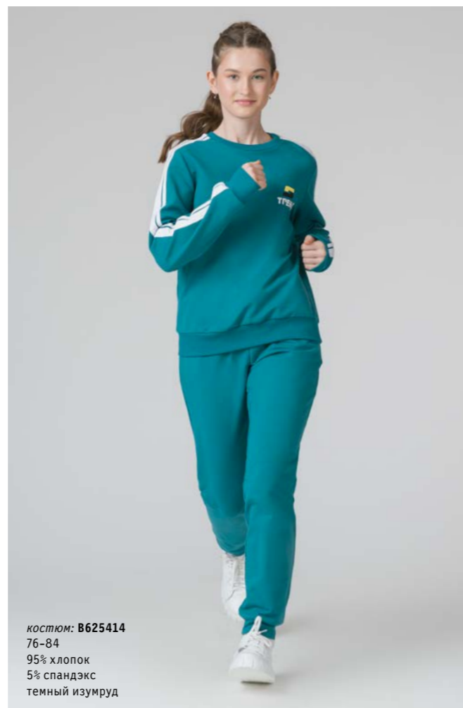
костюм: В625414 76-84 95% хлопок 5% спандэкс темный изумруд

Коллекция представлена актуальными практичными спортивными костюмами. Модели отличаются современным дизайном, удобными конструкциями, полотном, хорошо сохраняющим форму и насыщенность цвета. В качестве отделки используются молнии, канты и штучные печати.