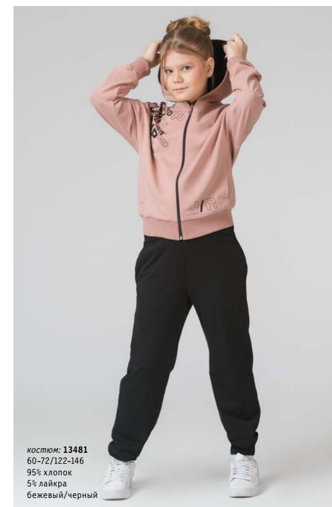
костюм: 13481 60-72/122-146 95% хлопок 5% лайкра бежевый/черный