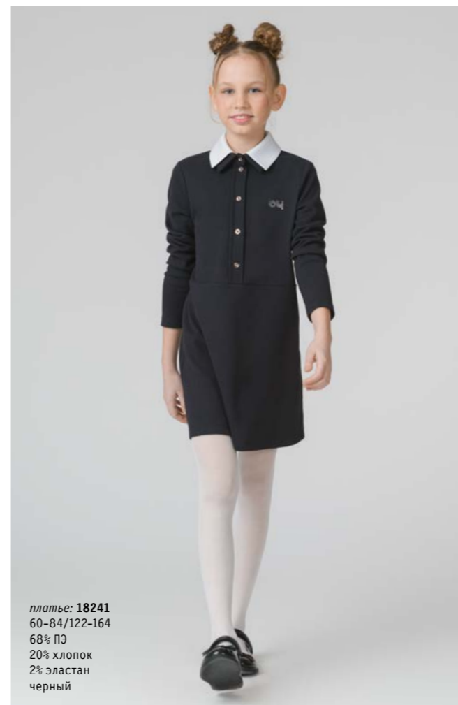
платье: 18241 60-84/122-164 68% ПЭ 20% хлопок 2% эластан черный