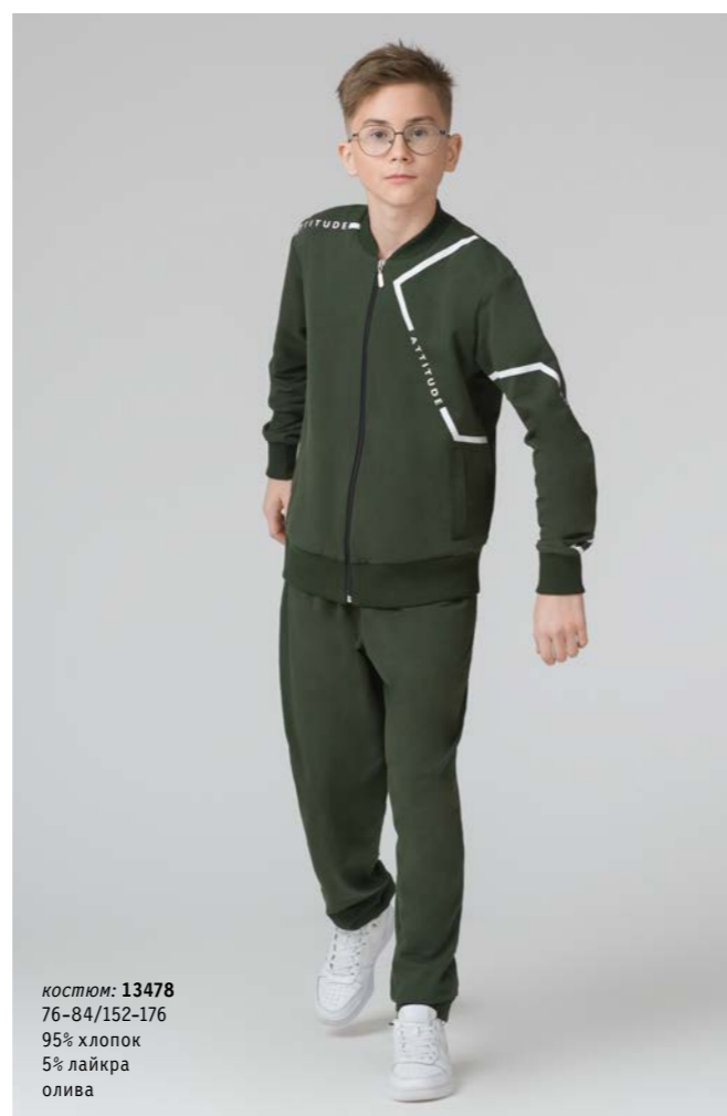
костюм: 13478 76-84/152-176 95% хлопок 5% лайкра олива

«ТОК» – энергия, импульс, движение, заряд.