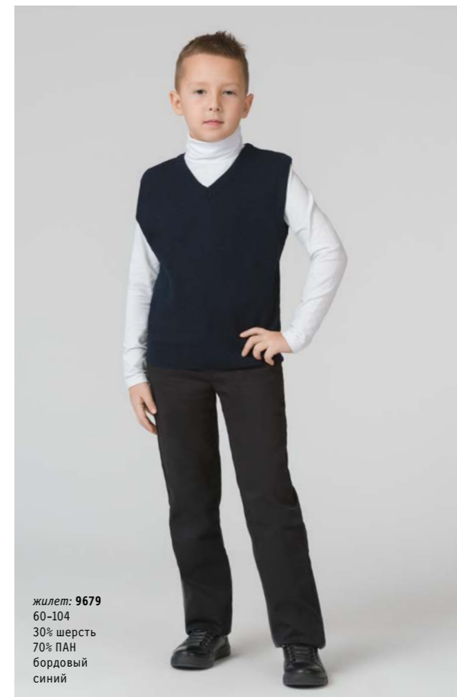
жилет: 9679 60-104 30% шерсть 70% ПАН бордовый синий