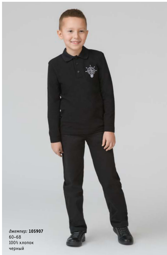
джерсер: 105907 60-68 100% хлопок черный