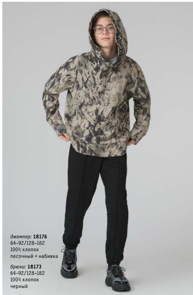
джерпер: 18176 64-92/128-182 100% хлопок песочный + набивка