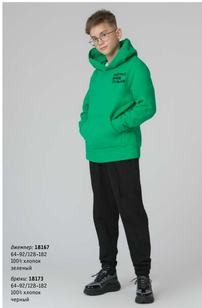
джерпер: 18167 64-92/128-182 100% хлопок зеленый