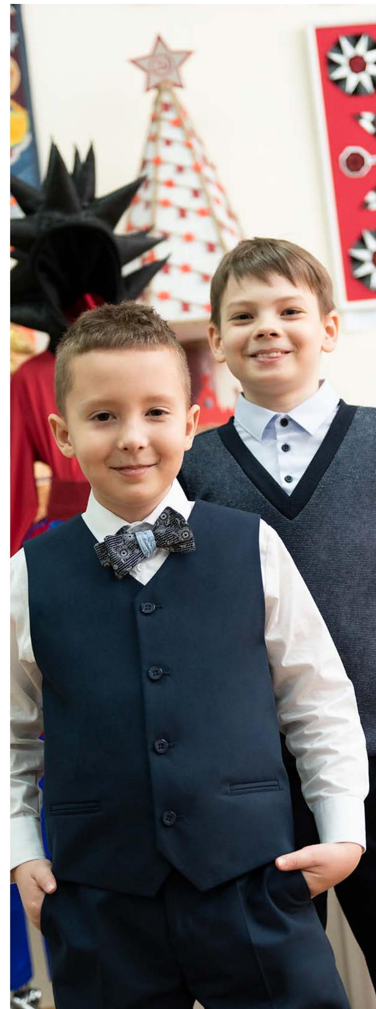
брюки: 20639-22/2 60-76/122-146 35% вискоза 63% ПЭ 2% лайкра синий