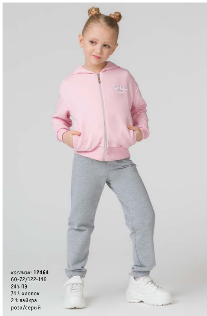
костюм: 12464 60-72/122-146 24% ПЭ 74% хлопок 2% лайкра роза/серый