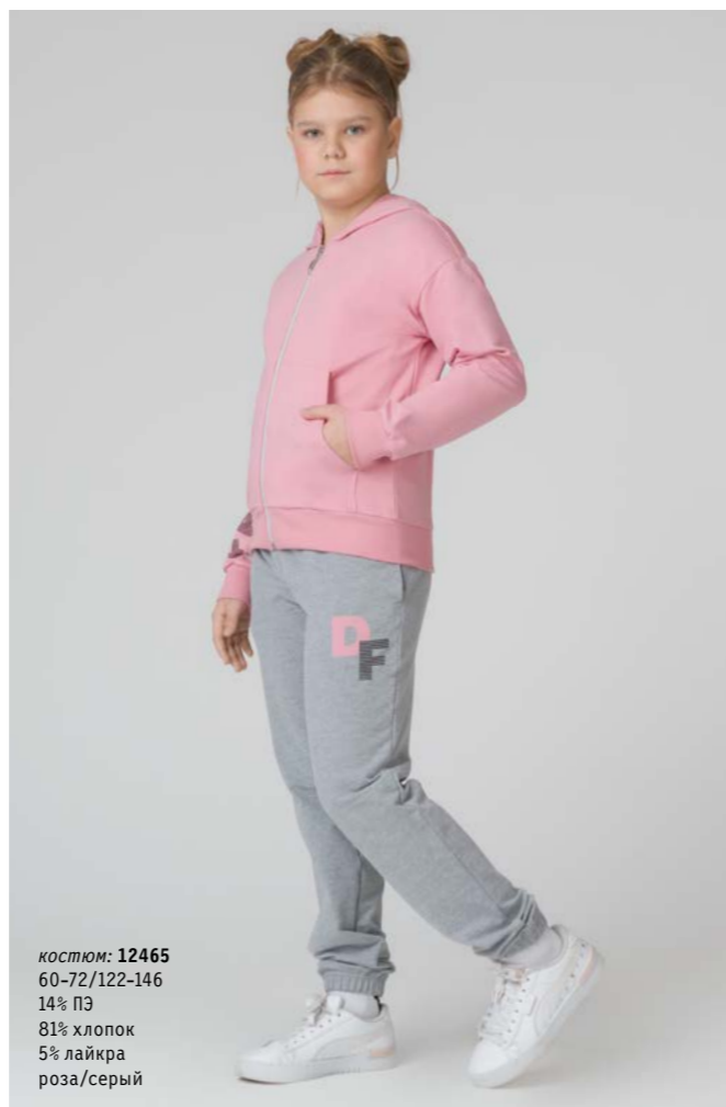
костюм: 12465 60-72/122-146 14% ПЭ 81% хлопок 5% лайкра роза/серый