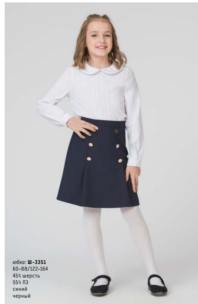
юбка: Ш-3351 60-88/122-164 45% шерсть 55% ПЭ синий черный