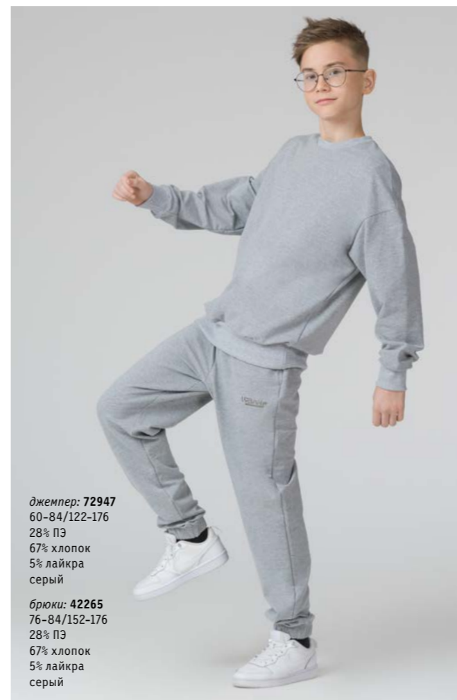
джерсер: 72947 60-84/122-176 28% ПЭ 67% хлопок 5% лайкра серый