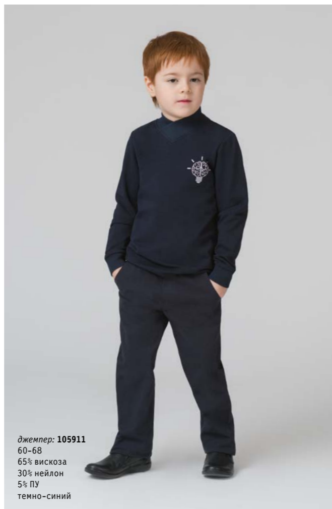
джерсер: 105911 60-68 65% вискоза 30% нейлон 5% ПУ темно-синий