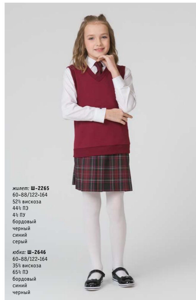
жилет: Ш-2265 60-88/122-164 52% вискоза 44% ПЭ 4% ПУ бордовый черный синий серый юбка: Ш-2646 60-88/122-164 35% вискоза 65% ПЭ бордовый синий черный