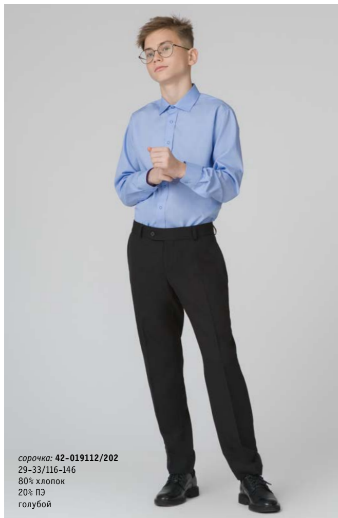
сорочка: 42-019112/202 29-33/116-146 80% хлопок 20% ПЭ голубой