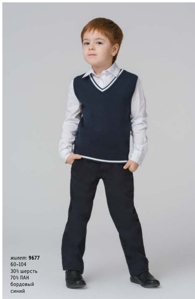
жилет: 9677 60-104 30% шерсть 70% ПАН бордовый синий