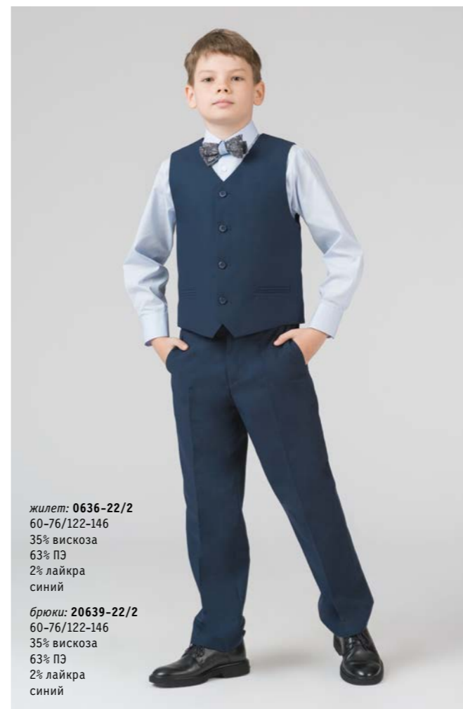
жилет: 0636-22/2 60-76/122-146 35% вискоза 63% ПЭ 2% лайкра синий