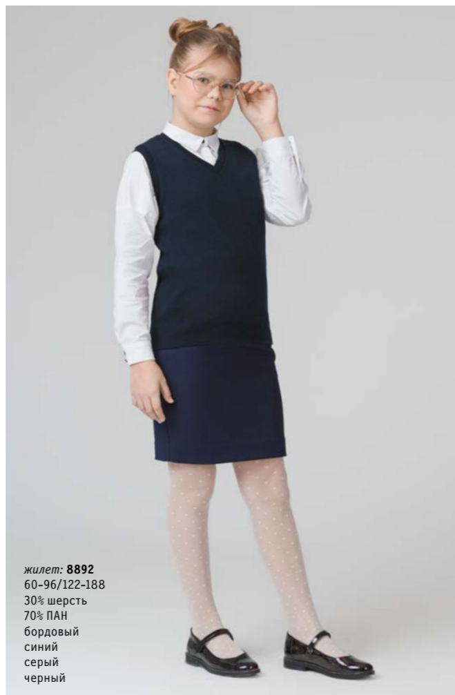
жилет: 8892 60-96/122-188 30% шерсть 70% ПАН бордовый синий серый черный

Качество продукции ОАО «Алеся» отвечает самым высоким Европейским критериям.