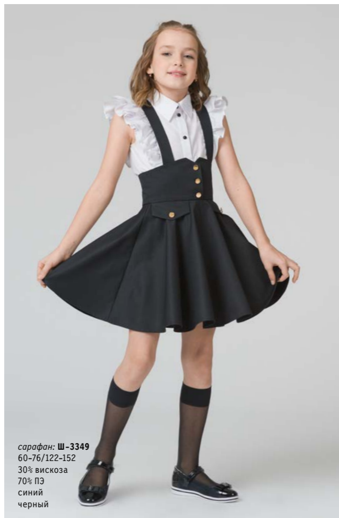
сарафан: Ш-3349 60-76/122-152 30% вискоза 70% ПЭ синий черный