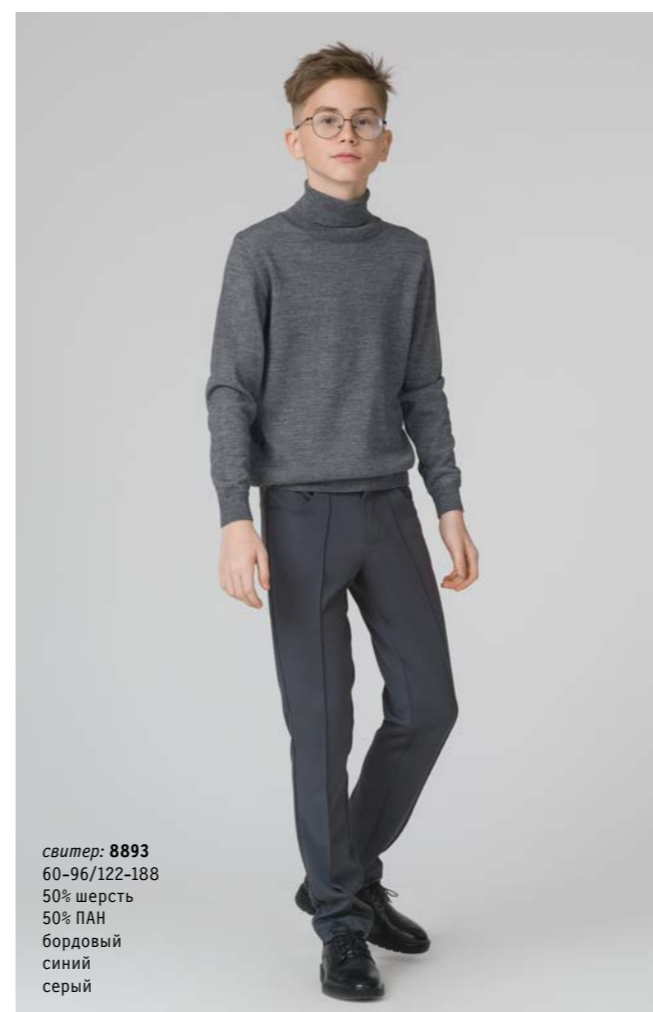
свитер: 8893 60-96/122-188 50% шерсть 50% ПАН бордовый синий серый