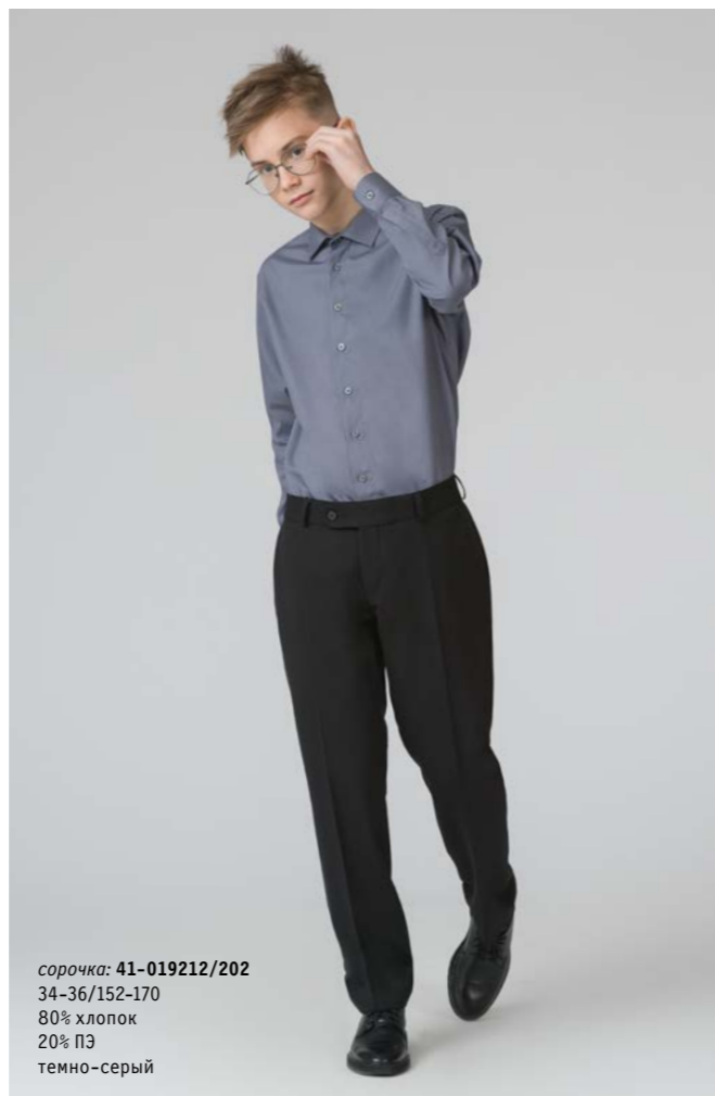
сорочка: 41-019212/202 34-36/152-170 80% хлопок 20% ПЭ темно-серый