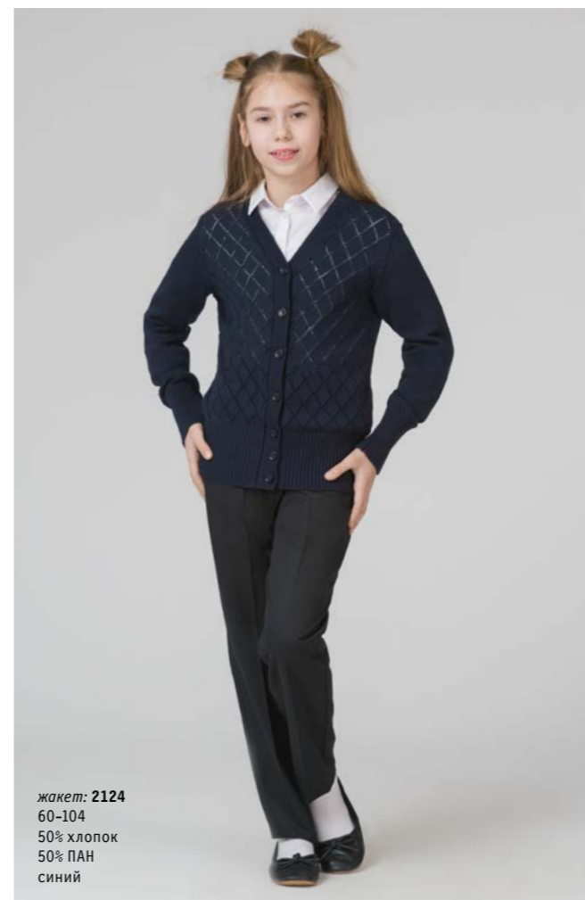
жакет: 2124 60-104 50% хлопок 50% ПАН синий