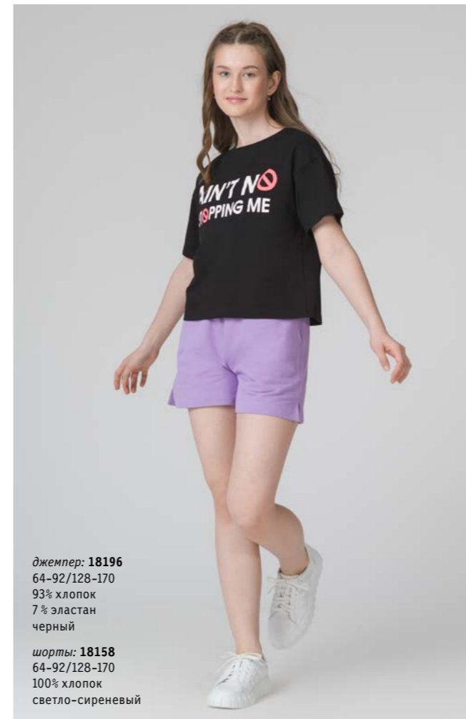
джерсер: 18196 64-92/128-170 93% хлопок 7% эластан черный шорты: 18158 64-92/128-170 100% хлопок светло-сиреневый