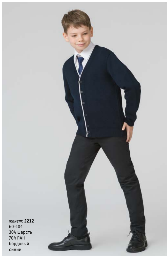
жакет: 2212 60-104 30% шерсть 70% ПАН бордовый синий