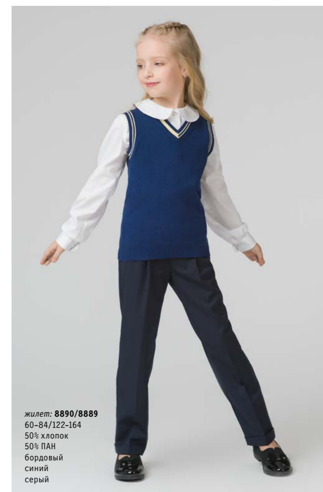
жилет: 8890/8889 60-84/122-164 50% хлопок 50% ПАН бордовый синий серый