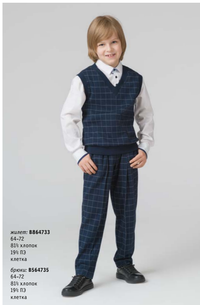
жилет: B864733 64-72 81% хлопок 19% ПЭ клетка

Одежда ОАО «СВІТАНАК» сочетает в себе современность, модный дизайн и высокое качество изделий по доступным ценам. Универсальность наших коллекций позволяет легко и просто комбинировать модели друг с другом и всегда выглядеть стильно и уверенно.