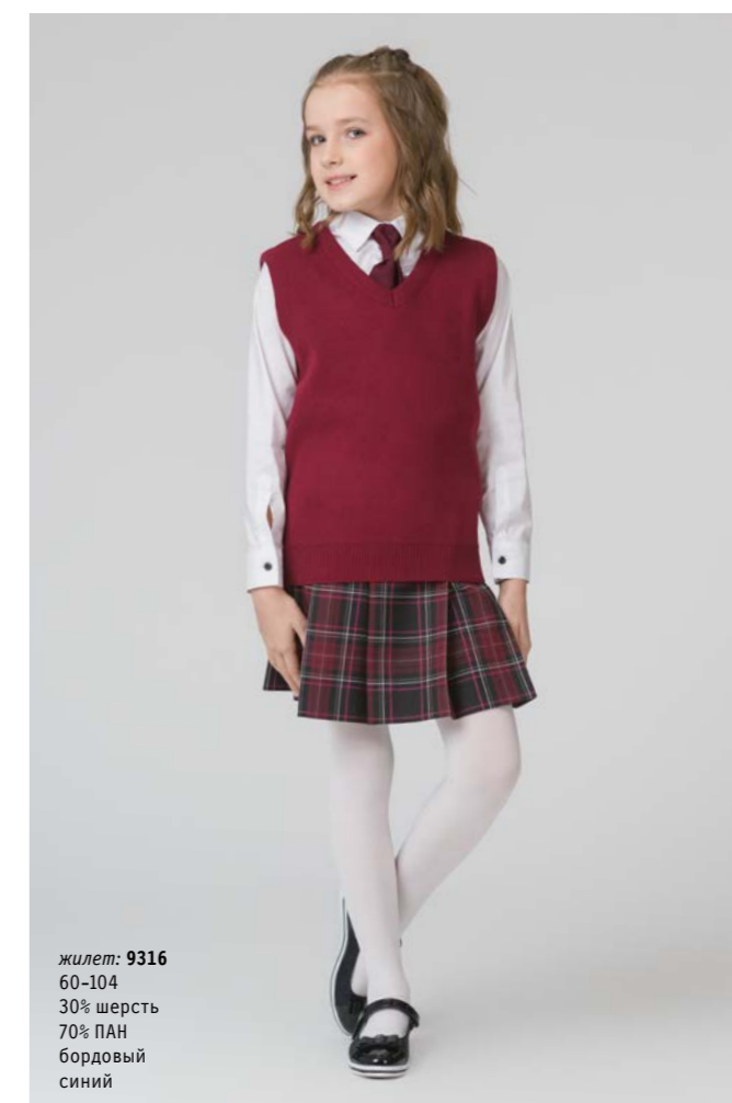
жилет: 9316 60-104 30% шерсть 70% ПАН бордовый синий