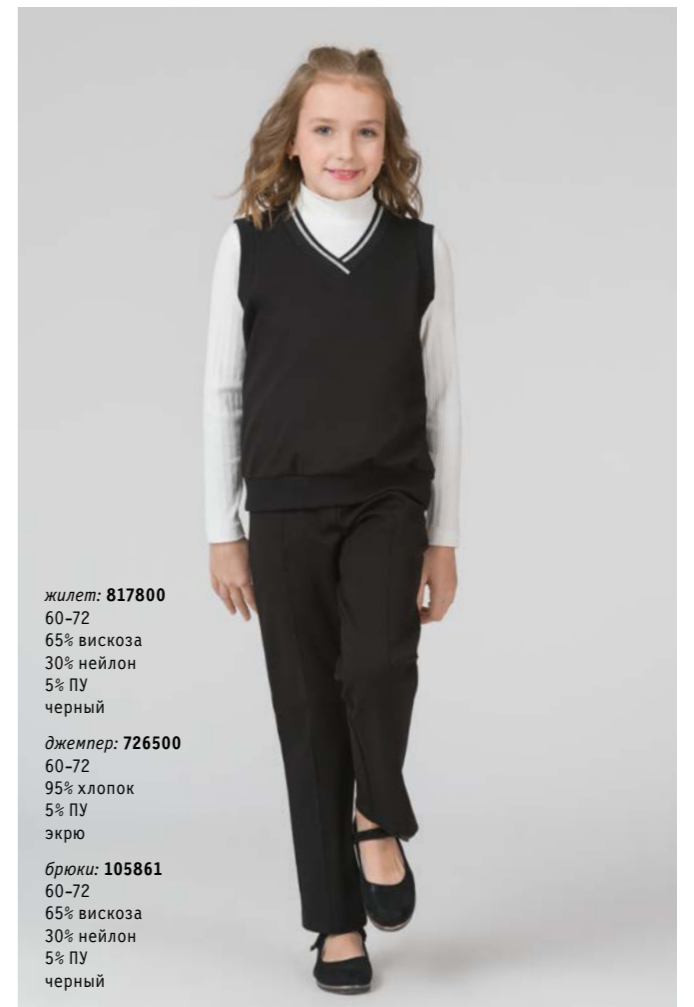
жилет: 817800 60-72 65% вискоза 30% нейлон 5% ПУ черный