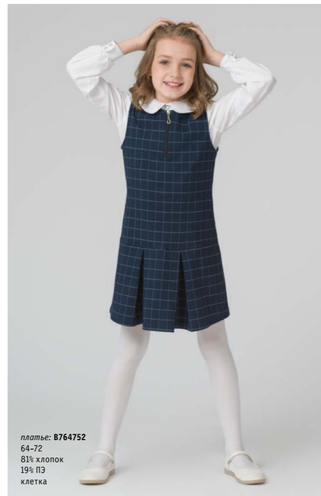
платье: B764752 64-72 81% хлопок 19% ПЭ клетка