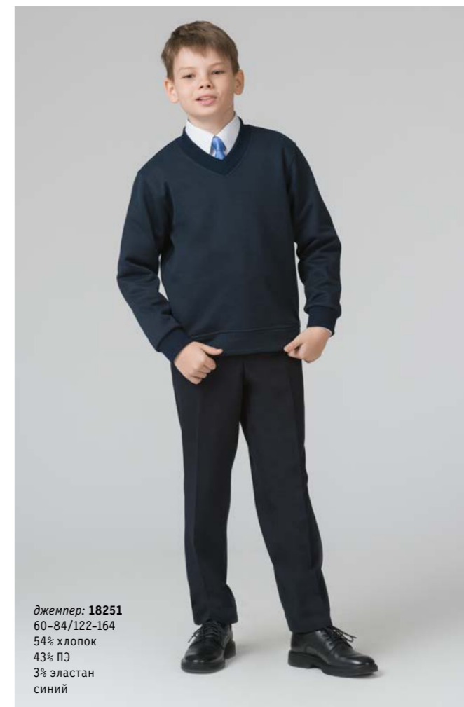
джерсер: 18251 60-84/122-164 54% хлопок 43% ПЭ 3% эластан синий