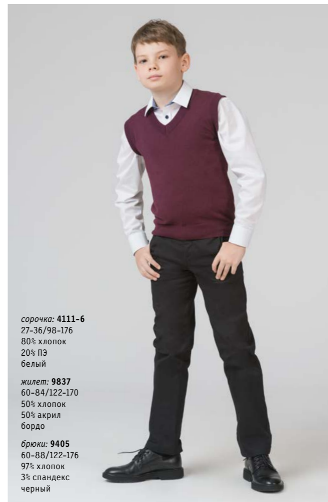
сорочка: 4111-6 27-36/98-176 80% хлопок 20% ПЭ белый жилет: 9837 60-84/122-170 50% хлопок 50% акрил бордо брюки: 9405 60-88/122-176 97% хлопок 3% спандекс черный