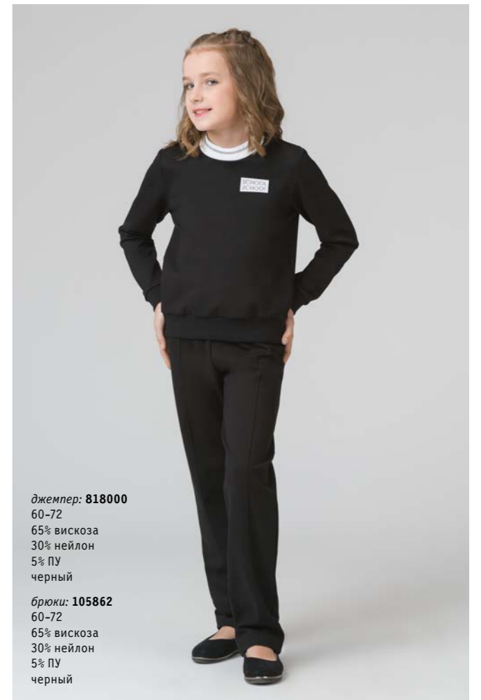
джерсер: 818000 60-72 65% вискоза 30% нейлон 5% ПУ черный