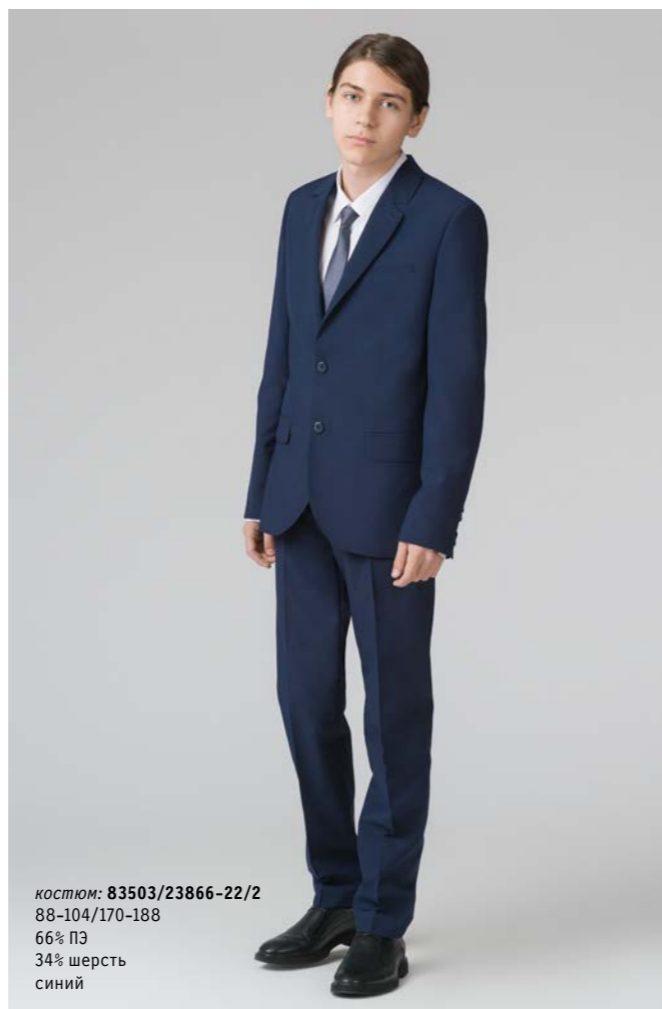
костюм: 83503/23866-22/2 88-104/170-188 66% ПЭ 34% шерсть синий