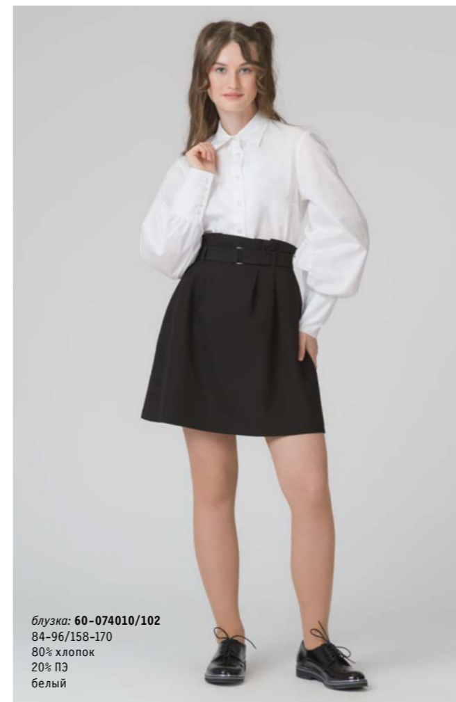
блузка: 60-074010/102 84-96/158-170 80% хлопок 20% ПЭ белый