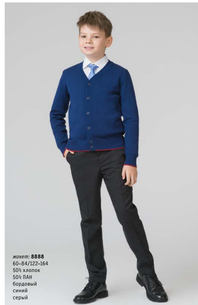
жакет: 8888 60-84/122-164 50% хлопок 50% ПАН бордовый синий серый