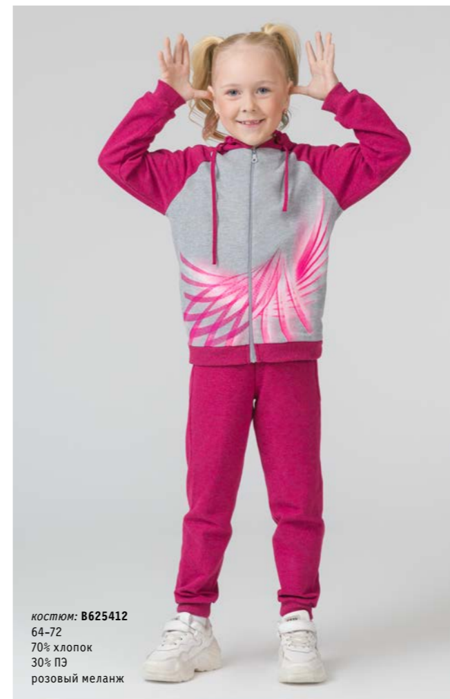
костюм: В625412 64-72 70% хлопок 30% ПЭ розовый меланж