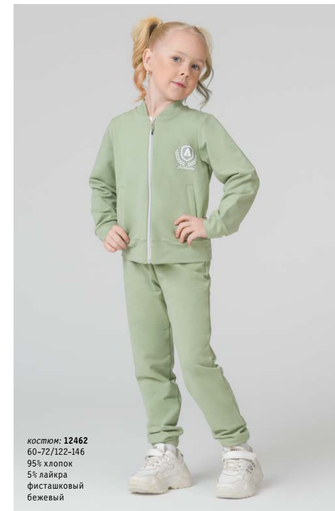
костюм: 12462 60-72/122-146 95% хлопок 5% лайкра фисташковый бежевый