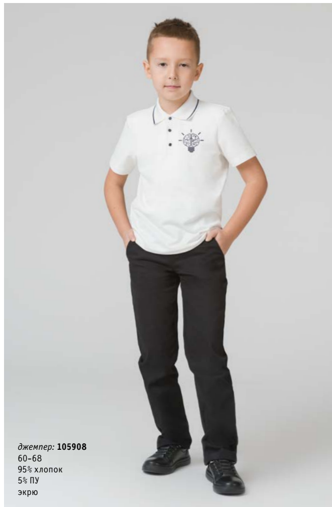
джерсер: 105908 60-68 95% хлопок 5% ПУ экрю