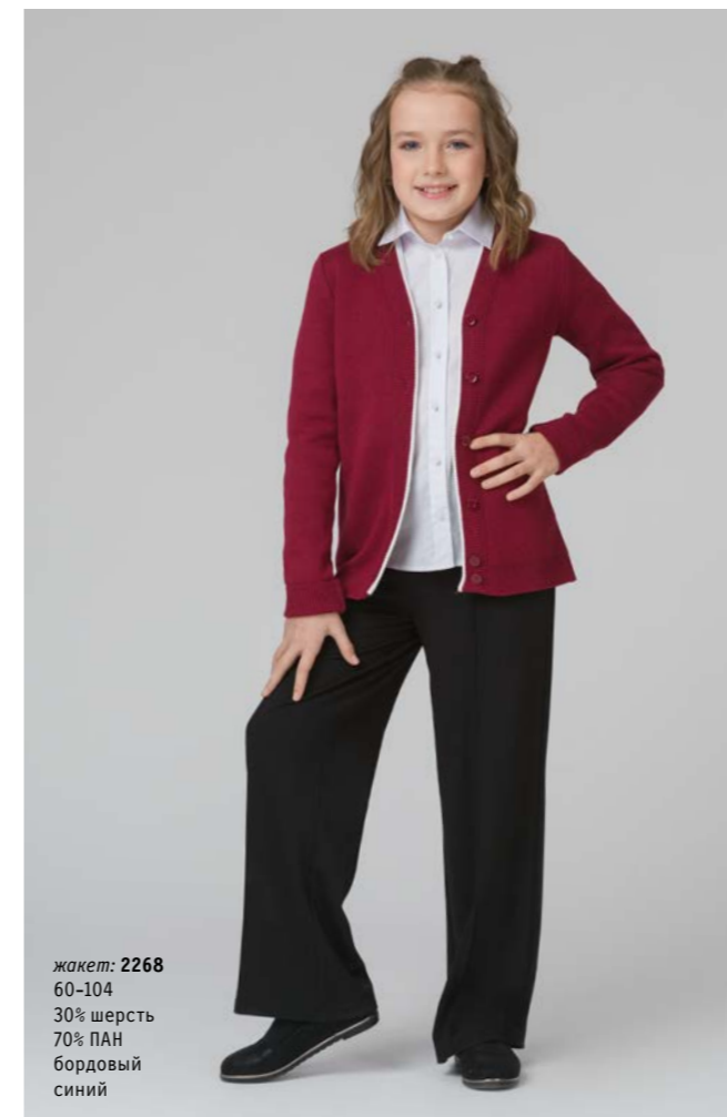
жакет: 2268 60-104 30% шерсть 70% ПАН бордовый синий

Коллекция состоит из изделий для девочек и мальчиков в классических расцветках. Правильный крой и эластичные ткани идеально подходят на любую комплекцию и помогают правильно расставлять акценты. Безупречное качество делает одежду удобной и практичной в ежедневной носке.