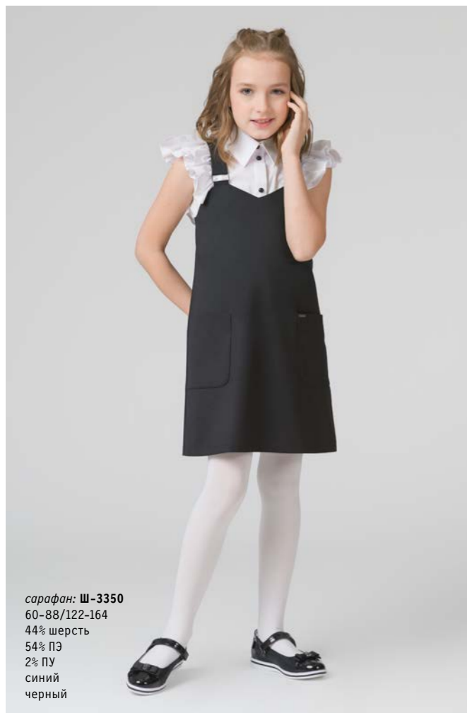
сарафан: Ш-3350 60-88/122-164 44% шерсть 54% ПЭ 2% ПУ синий черный