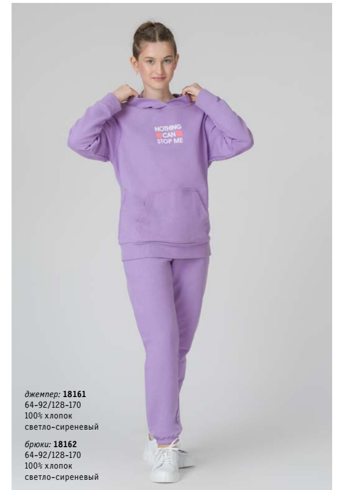
джерсер: 18161 64-92/128-170 100% хлопок светло-сиреневый брюки: 18162 64-92/128-170 100% хлопок светло-сиреневый